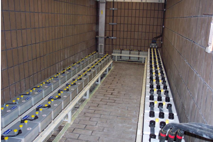
Gambar 3. Susunan Baterai Lama

Salah satu keunggulan dari baterai ini adalah adanya AquaGen yang berfungsi mengembalikan uap air (hidrogen dan oksigen) dari penguapan air baterai kembali ke baterai, sehingga air tidak berkurang selama tidak terjadi kebocoran pada baterai.