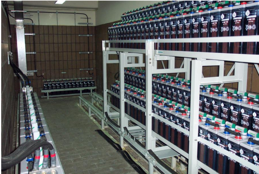
Gambar 4. Susunan Batere BTB

Uji fungsi yang dilakukan meliputi pengukuran tegangan batere dan pengukuran densitas dari air batere, setelah terhubung dengan beban. Dari pengukuran tegangan per batere per sel dan total sel, menunjukkan tidak ada penyimpangan yang telah ditentukan seperti terlihat pada Tabel 3 dan Tabel 4.