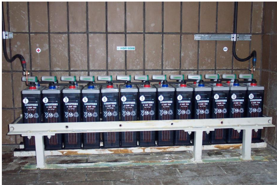
Gambar 6. Susunan Batere BTJ (- 24 Volt)