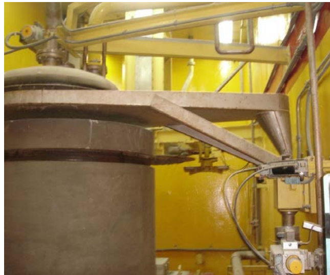
Gambar 2. Shell beton siap diisi Resin Bekas

Selanjutnya resin bekas akan dialirkan ke shell beton 950 liter yang telah disiapkan di ruang hot cell . (Gambar 2).