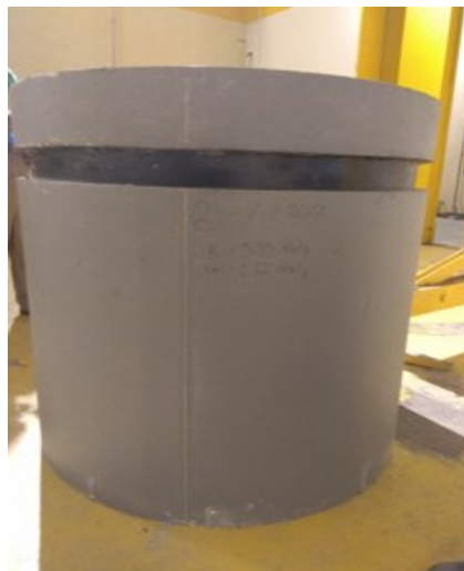
Gambar 3. Shell beton 950 l hasil olahan siap disimpan di IS1

Dengan pengolahan limbah radioaktif resin bekas dalam shell beton 950 liter akan menjamin keselamatan dan keamanan bagi pekerja, masyarakat dan lingkungan. Proses imobilisasi resin bekas dilaksanakan di Gedung 50 PTLR dan limbah hasil olahan disimpan di Gedung Interim Storage Gedung nomor 52, seperti terlihat pada Gambar 3, shell beton 950 l yang sudah siap diangkut untuk disimpan di Gedung IS 1.