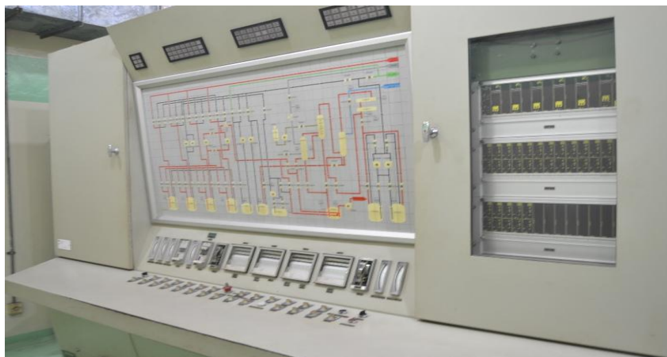
Gambar 2. Panel Kontrol Evaporasi I 22001

Sebelum di evaporasi limbah cair ditampung dalam tangki penampungan limbah cair yaitu tangki R 2201A/B/C dan D, masing – masing kapasitasnya 50 m 3 . Kemudian diambil cuplikannya untuk dianalisis apakah limbah cair radioaktif sudah memenuhi persyaratan atau belum. Jika belum memenuhi syarat limbah cair dinetralisasi menggunakan asam/ soda, sedangkan jika telah memenuhi persyaratan limbah radioaktif cair siap dievaporasi.