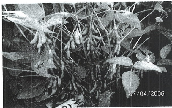
Gambar 1. Penampilan galur mutan M.220 saat berpolong