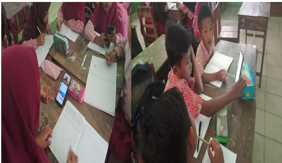
Gambar 3. Foto pembelajaran kooperatif Numbered Head Together (NHT)

Interaksi antara guru dan siswa tidak dapat sembarangan dilakukan. Mesti adanya metode yang baik agar siswa dapat menerima informasi dari guru dengan benar dan tidak terjadi kesalahpahaman dalam menerima informasi dari guruke siswa. Penelitian lain oleh Rausah et al. (2023) mengkaji strategi kepala sekolah dalam meningkatkan kinerja guru di era Revolusi Industri 4.0. Model pembelajaran kooperatif tipe NHT juga memiliki manfaat lain, seperti meningkatkan motivasi belajar siswa, memperluas pemahaman melalui diskusi kelompok, meningkatkan keterampilan social, dan membangun sikap saling menghargai antar siswa, melalui model ini, siswa juga diajarkan untuk bertanggung jawab terhadap kemajuan belajar kelompoknya, sehingga memupuk rasa kebersamaan dan kepedulian terhadap prestasi akademik. Namun, perlu diingat bahwa implementasi model pembelajaran kooperatif tipe NHT juga memiliki tantangan tersendiri. Diperlukan persiapan yang matang, pengaturan kelompok yang efektif, serta pengawasan yang tepat tagar tujaun pembelajaran dapat tercapai dengan baik. Pemberian hadiah untuk semangat belajar siswa.