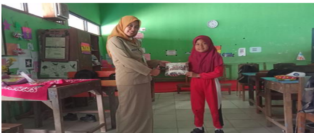
Gambar 4. Foto Pemberian hadiah kepada Siswa

Interaksi antara guru dan siswa tidak dapat sembarangan dilakukan. Mesti adanya metode yang baik agar siswa dapat menerima informasi dari guru dengan benar dan tidak terjadi kesalahpahaman dalam menerima informasi dari guru ke siswa. Penelitian lain oleh Rausah et al. (2023) mengkaji strategi kepala sekolah dalam meningkatkan kinerja guru di era Revolusi Industri 4.0. Model pembelajaran kooperatif tipe NHT juga memiliki manfaat lain, seperti meningkatkan motivasi belajar siswa, memperluas pemahaman melalui diskusi kelompok, meningkatkan keterampilan social, dan membangun sikap saling menghargai antar siswa, melalui model ini, siswa juga diajarkan untuk bertanggung jawab terhadap kemajuan belajar kelompoknya, sehingga memupuk rasa kebersamaan dan kepedulian terhadap prestasi akademi. Namun, perlu diingat bahwa implementasi model pembelajaran kooperatif tipe NHT juga memiliki tantangan tersendiri. Diperlukan persiapan yang matang, pengaturan kelompok yang efektif, serta pengawasan yang tepat agar tujuan pembelajaran dapat tercapai dengan baik. Pemberian hadiah untuk semangat belajar siswa.