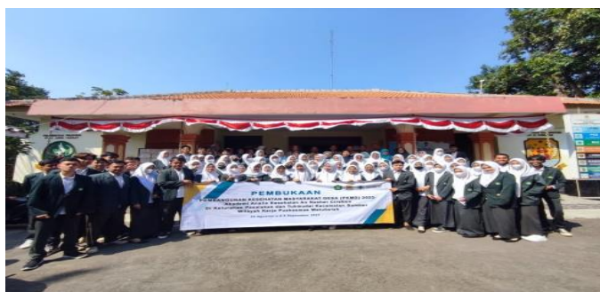
Gambar 2. Musyawarah Masyarakat Desa

Kegiatan pengabdian dalam bentuk PKM ini dilaksanakan di Kelurahan Tukmudal dan Pasalakan, Kecamatan Sumber, Kabupaten Cirebon. Pelaksanaan kegiatan PKM berlangsung pada tanggal 24 Agustus 2023 sampai dengan tanggal 4 September 2023.