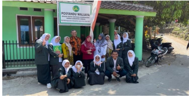
Gambar 3. Kegiatan Posyandu dan Penyebaran Kuisisioner

45 tahun dan tekanan darah maksimal 140/90 mmHg. Kemudian dilanjutkan dengan pengambilan sampel darah untuk dilakukan pemeriksaan HCV.