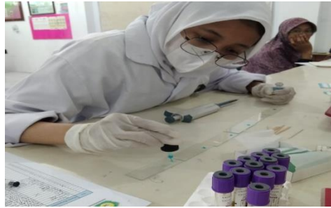
Gambar 4. Pemeriksaan Skrining Bank Darah di Laboratorium