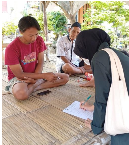
Gambar 4. Penyebaran Penyebaran dan Wawancara Langsung

Pada pemeriksaan HCV dilakukan menggunakan metode kualitatif yaitu dengan test strip HCV . Sebelum melakukan pemeriksaan HCV ini, sampel responden harus diperiksa kadar hemoglobin terlebih dahulu, kadar hemoglobin yang diperiksa harus lebih dari 10 gr/dl. Jika kadar hemoglobin sudah sesuai, maka dilanjut ke pemeriksaan HCV. Sampel darah yang sudah diperiksa kadar hemoglobinnya diputar pada sentrifugal untuk memisahkan darah dan serum, untuk pemeriksaan HCV spesimen yang digunakan hanya serum. Pemeriksaan HCV diawali dengan menyiapkan test strip kemudian ditetaskan satu tetes serum pada daerah pengujian, dan satu tetes reagen HCV buffer , lalu di tunggu 15 menit untuk mendapatkan hasilnya. Jika terdapat garis dua merah pada daerah pengujian menunjukkan hasil reaktif, sedangkan jika terdapat hanya satu garis berwarna merah pada daerah pengujian maka hasilnya non-reaktif.