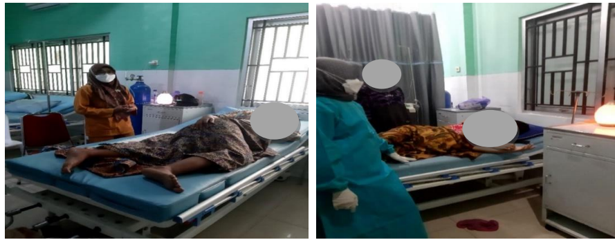
Gambar 4. Praktik Penggunaan Aromaterapi Lavender