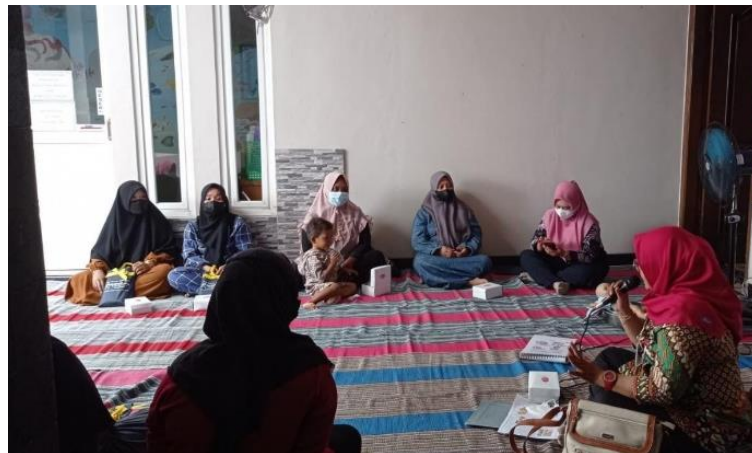
Gambar 3. Sesi penyuluhan