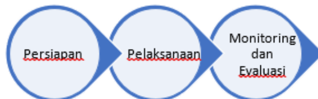
Gambar 2. Bagan Alir kegiatan

Kegiatan ini dilaksanakan di Puskesmas Petarukan, Kabupaten Pemalang pada 1 Februari 2023. Metode yang digunakan dalam kegiatan ini berupa penyuluhan tentang penerapan terapi komplementer aromaterapi lavender sebagai upaya mengontrol nyeri persalinan. Adapun kegiatan yang dilaksanakan berupa ceramah, diskusi, dan praktik pemberian aromaterapi lavender kepada peserta secara langsung. Media yang digunakan untuk menyampaikan materi berupa leaflet. Peserta pada kegiatan ini sebanyak 10 ibu hamil trimester III yang melakukan kunjungan kesehatan sebelum memasuki HPL. Tahapan pelaksanaan kegiatan ini terdiri dari tahap persiapan, pelaksanaan serta monitoring dan evaluasi. Berikut alur kegiatan pengabdian.