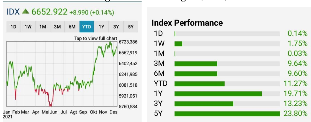
Gambar 2 Performa Indeks Harga Saham Gabungan (IHSG) Selama tahun 2021