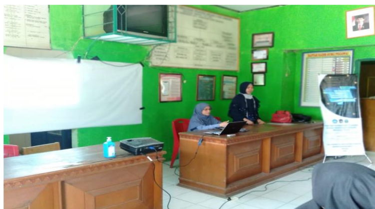
Gambar 1. Tim Pengabdian Memberikan Pengarahan kepada Peserta Didik

Sejalan dengan pendapat Eady dan Lockyer (2013) yang mengungkapkan bahwa teknologi informasi perlu menjadi bagian utuh yang tidak terpisahkan dalam kegiatan pembelajaran yang menarik di sekolah.