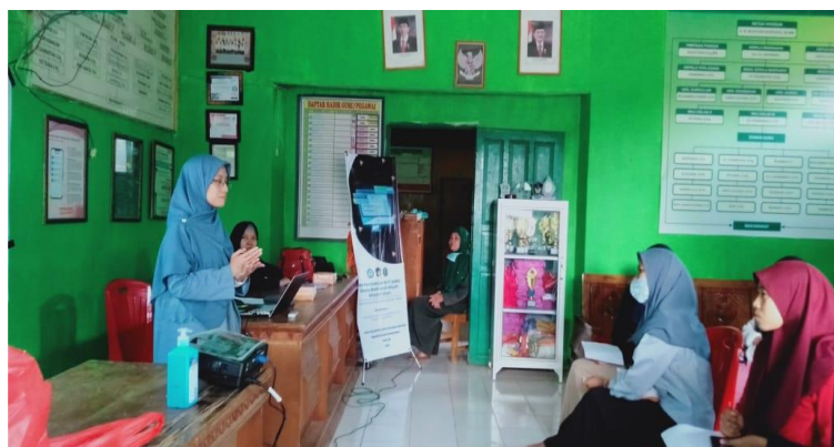
Gambar 2. Anggota Tim Pengabdian Memberikan Materi kepada Peserta Didik