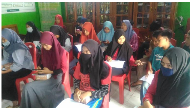
Gambar 3. Pelatihan Menggunakan Media Pembelajaran Online

Berdasarkan kuesioner evaluasi kegiatan pengabdian yang telah disebar dan melalui wawancara kepada peserta kegiatan hasilnya menunjukkan bahwa kegiatan perlu adanya upaya para pemangku kepentingan, baik pihak sekolah maupun pemerintah, untuk sering melakukan sosialisasi untuk meningkatkan pengetahuan siswa dan guru di pesantren. Media pembelajaran online yang diterapkan dapat digunakan oleh siswa dan guru secara bersamaan. Partisipasi masyarakat juga diperlukan untuk mengembangkan program-program yang telah direncanakan demi peningkatan pengetahuan mitra melalui penerapan teknologi. Selain itu, perlu dilakukan monitoring dan pendampingan secara berkesinambungan terhadap mitra dalam meningkatkan wawasan dan ilmu pengetahuan.