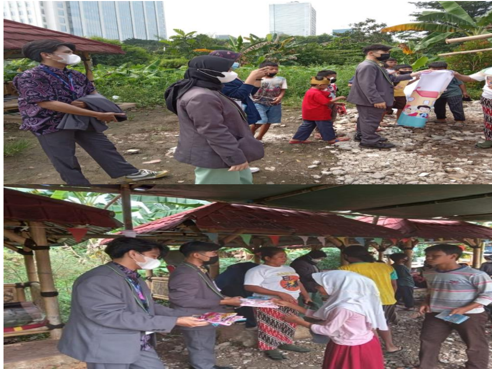
Gambar 2. Penyuluhan Anti Kekerasan Seksual

Hasil Pengetahuan baik 15 75% dan pengetahuan kurang 5 25%. Kegiatan penyuluhan ini bertujuan agar remaja memahami tentang anti kekerasan seksual. Pada pengabdian masyarakat ini dilakukan pendidikan kesehatan kepada remaja putri mengenai bahaya kekerasan seksual. Kegiatan penyuluhan berlangsung kurang lebih 30 menit dan terlaksana dengan tertib dan lancar serta mendapat antusias yang baik dari peserta. Kegiatannya adalah melakukan pendidikan kesehatan berupa penyuluhan tentang bahaya kekerasan seksual. pada remaja meliputi definisi, kekerasan seksual. Pencegahan kekerasan seksual. Gejala kekerasan seksua remaja cukup memahami dan sangat antusias dalam kegiatan ini, beberapa siswi bertanya khususnya tentang kekerasan seksual. Pada akhir evaluasi dilakukan sesi tanya jawab untuk mengetahui sejauh mana pemahaman remaja tentang bahaya kekerasan seksual.