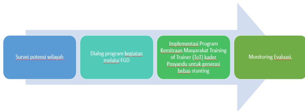
Gambar 2. Alur Pelaksanaan PKM

Kegiatan ini dilaksanakan di Kelurahan Pasir Putih Sawangan Depok. Bentuk kegiatan berupa Training of Trainer kader posyandu dengan peserta kader dari posyandu di RW 02 kelurahan pasir putih. Peserta berjumlah 13 orang kader dari 10 posyandu. Kegiatan ini dilakukan pada tanggal 1-30 Juni 2023. Pengabdian melakukan beberapa tahapan dalam pelaksanaan kegiatan pelatihan ini yang terdiri dari (1) Survey potensi wilayah dalam hal ini penilain potensi kader posyandu tentang pemeriksaan tumbuh kembang anak, (2) Diskusi Program kegiatan, (3) Implementasi program (4) Monitoring dan Evaluasi.