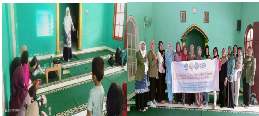
Gambar 3. Dokumentasi Kegiatan Pelatihan Kader Posyandu

Pelatihan kader kesehatan efektif meningkatkan pengetahuan, sikap, dan keterampilan kader kesehatan tentang deteksi dini dan faktor risiko stunting . Salah satu bentuk upaya meningkatkan kemampuan kader kesehatan dalam deteksi dini stunting dan faktor risiko balita dapat dilakukan dengan pelatihan kader kesehatan (Tampake et al., 2021). peningkatan pemahaman kader kesehatan tentang deteksi dini stunting dapat dilakukan melalui penyuluhan dan pelatihan (Yuliani et al., 2017). setelah pelatihan, kader Posyandu dapat memahami deteksi dini stunting . Selain itu, penelitian menunjukkan bahwa kader posyandu mempunyai peran penting dalam memberikan informasi gizi optimal dalam mencegah stunting dan mengidentifikasi faktor risiko stunting di wilayah kerja Posyandu. (Megawati & Wiramihardja, 2019).