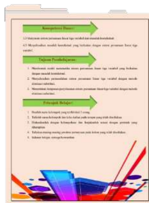
Gambar 2. Desain Kedua Bahan Ajar Berbasis Scientific Learning

Desain halaman kedua pada bahan ajar LKPD yang telah dikembangkan dalam penelitian ini yaitu terdapat Kompetensi Dasar (KD), tujuan pembelajaran, dan petunjuk belajar. Desain kedua dapat dilihat pada gambar berikut.