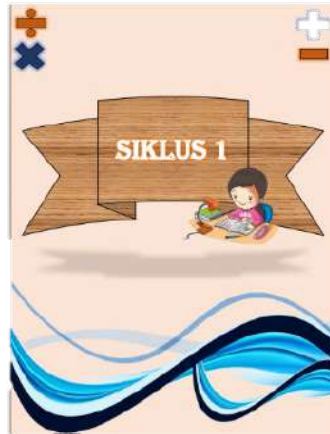
Gambar 3. Desain siklus 1