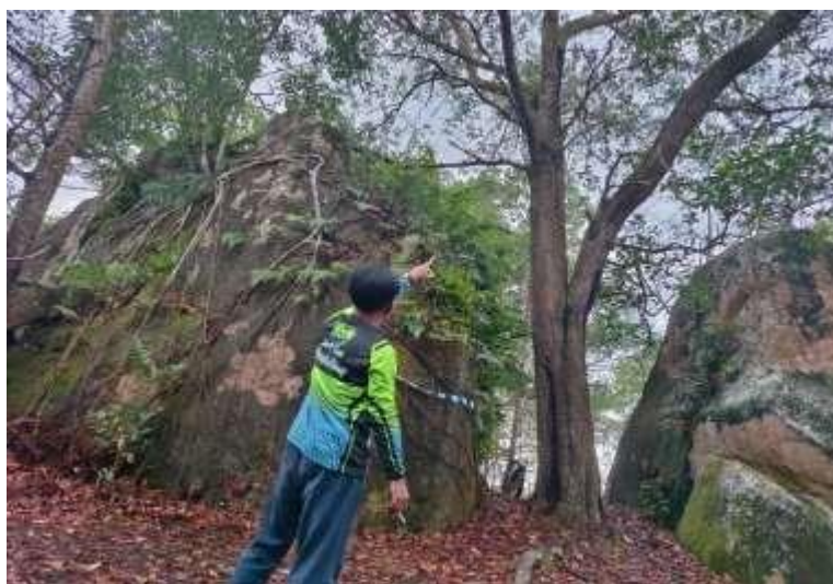
Gambar 7. Singkapan batuan sebagai sarana edukasi