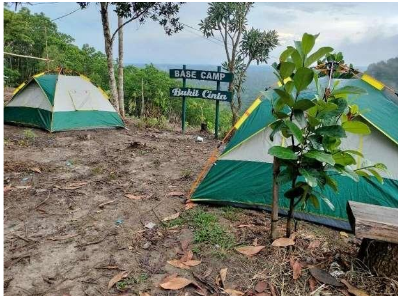
Gambar 6. Camping ground di lokasi geowisata