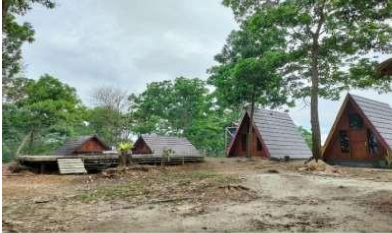
Gambar 5. Penginapan di lokasi geowisata