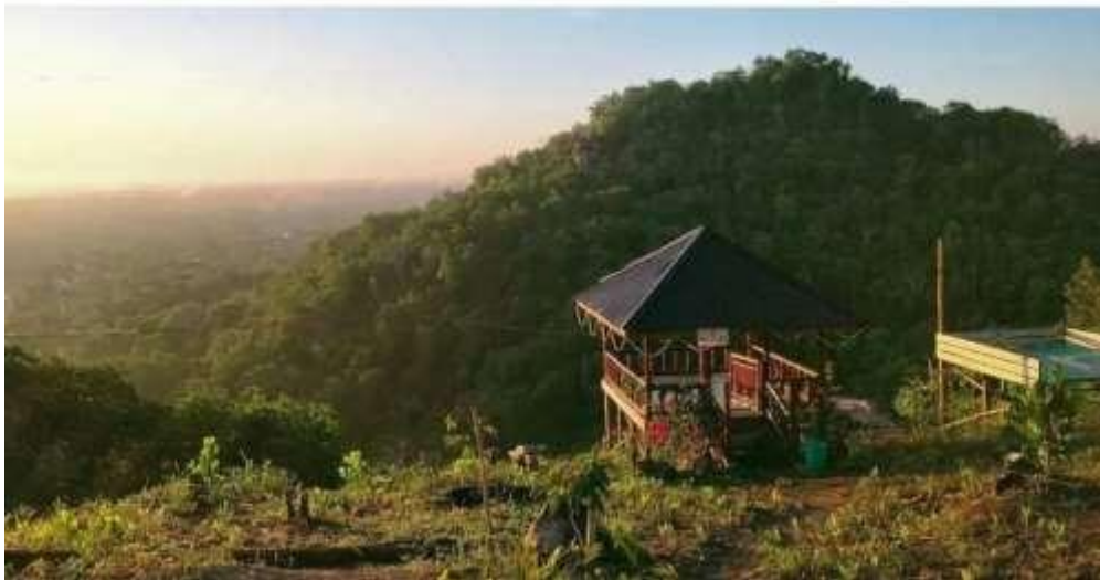
Gambar 3. Lokasi geowisata