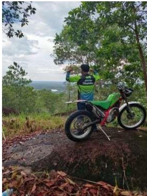
Gambar 4. Jalur mountain biking di lokasi geowisata