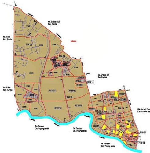
Gambar 1. Peta Wilayah Kelurahan Sri Meranti