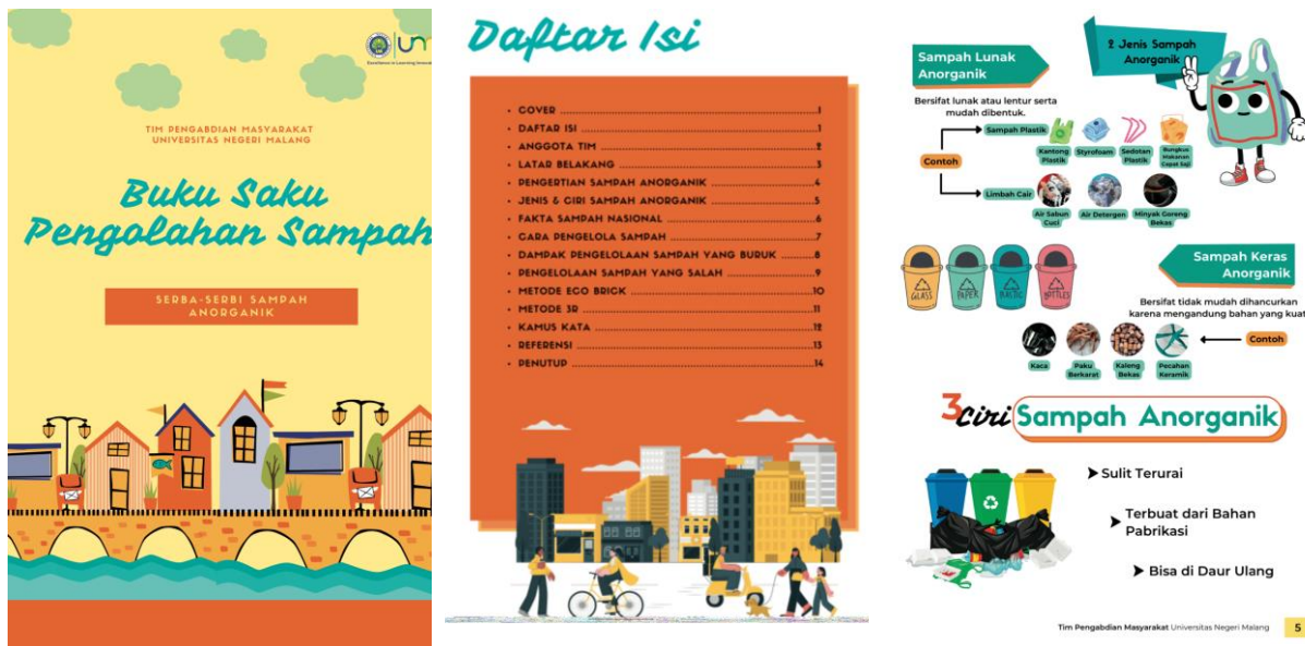
Gambar 2. Buku Saku Pengolahan Sampah

Secara ringkas, buku saku pengolahan sampah memuat informasi sampah organik yang terbagi menjadi empat bagian. Bagian pertama mendeskripsikan karakteristik sampah anorganik meliputi jenis, ciri, disertai contohnya di lingkungan rumah tangga. Bagian kedua menunjukkan data mengenai jumlah sampah anorganik di Indonesia untuk menunjukkan bahwa persoalan sampah anorganik masih menjadi masalah yang serius. Bagian ketiga membahas dampak sampah anorganik untuk menumbuhkan keprihatinan sasaran sehingga tergerak untuk melakukan perubahan perilaku. Bagian keempat menjelaskan cara-cara yang tepat dan mudah dalam mengelola sampah anorganik untuk dijadikan pedoman bagi sasaran. Keseluruhan buku saku pengolahan sampah didesain dengan bergambar dan berwarna dengan harapan sasaran memahami informasi dengan mudah dan termotivasi untuk mempelajarinya. Buku saku juga dicetak dengan kertas tebal dan tahan air sehingga tidak mudah rusak. Praktik pemberian edukasi di bidang kesehatan berbasis buku saku sebagai media nya sudah seringkali dilakukan. (12,13) Beberapa studi sebelumnya menunjukkan bahwa penggunaan buku saku berhasil dalam mewujudkan peningkatan pengetahuan pada sasaran. (14,15)