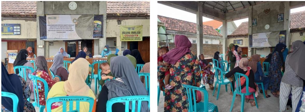
Gambar 3. Penyuluhan tentang Sampah Anorganik