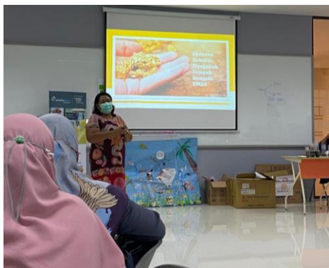
Gambar 4. Proses diskusi dan pemaparan materi

Dalam mengikuti rangkaian kegiatan, para peserta sangat antusias terutama saat sesi simulasi. Seluruh peserta berkontribusi dalam mencari ide pengolahan atas sampah diberikan. Sebagai contoh peserta diminta untuk mengevaluasi sampah apa saja yang ada di lingkungan rumah tangga dan mencoba memberikan ide mengenai pengolahan sampah menjadi barang baru yang dapat dipergunakan kembali, bahkan dapat juga untuk dijual. Kendala yang dihadapi adalah karena saat pelaksanaan kegiatan adalah saat pandemic COVID berlangsung, maka setiap sekolah hanya memberikan perwakilan 1-2 guru saja.