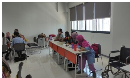
Gambar 5. Proses diskusi

Kurangnya pengetahuan tentang jenis sampah dan pengolahannya membuat masyarakat acuh terhadap pengelolaan sampah. Terdapat beberapa kasus yang memilih untuk membakar sampah dengan alasan praktis. Oleh karena itu, materi mengenai edukasi sampah memberikan pemahaman cara agar masyarakat dapat mengetahui bahwa dengan pengelolaan yang tepat, dapat memberikan dampak positif. Materi edukasi ini juga membahas mengenai jenis sampah, yang boleh dan tidak boleh dilakukan saat mendaur ulang dan proses daur ulang.