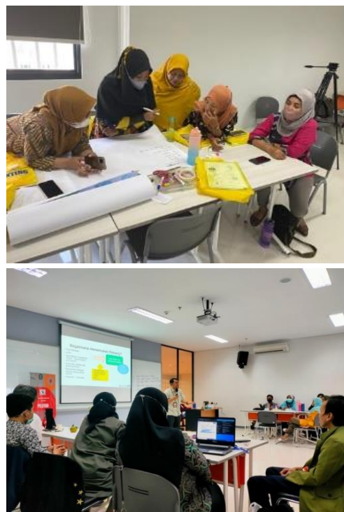
Gambar 2. Proses diskusi

Kegiatan pengabdian masyarakat diawali dengan diskusi kelompok untuk memetakan masalah dan sumber sampah utama di sekitar lingkungan sekolah. Berdasarkan kendala yang muncul, maka tim pelaksana dari Program Studi Akuntansi Universitas Ciputra Surabaya dan Plastic Bank Menyusun materi untuk program dengan para Guru Sekolah Dasar. Proses pengabdian masyarakat dilaksanakan dengan media simulasi, diskusi dan tanya jawab. Para guru sekolah dasar diajarkan bagaimana menjelaskan mengenai pengelolaan sampah kepada para siswa-siswi sekolah dasar. Diantaranya dengan membuat permainan dari botol bekas. Pada akhir acara, tim pelaksana melakukan evaluasi kegiatan