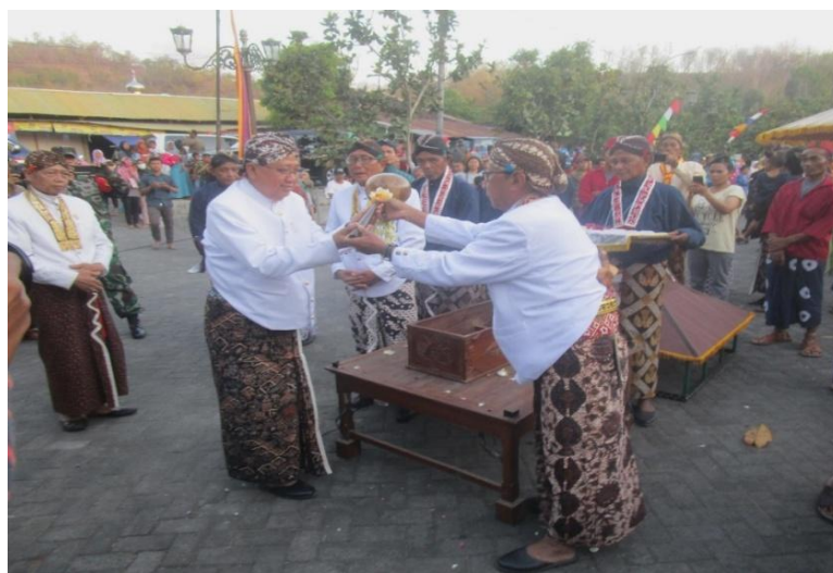
Gambar 4: Serah terima Siwur dari Bupati Bantul kepada Kepala Kantor Penjaga Makam, Kangjeng Bupati ketika kirab budaya Ngarak Siwur . Siwur tersebut akan diarak pada Kirab Budaya Ngarak Siwur di Imogiri.

Kirab Budaya Ngarak Siwur adalah ritual yang berhubungan dengan ritual Nawu Enceh yang pertama kali diselenggarakan pada sekitar awal abad ke-21. Kirab budaya tersebut diselenggarakan untuk melengkapi ritual Nawu Enceh dengan tujuan mengembangkan budaya lokal dan pariwisata. Situs Makam Imogiri menduduki peringkat ke-3 dalam destinasi wisata Kabupaten Bantul ( BPS Kabupaten Bantul, 2019 ). Pemerintah Daerah memiliki peran penting untuk mengembangkan budaya ini. Bupati Bantul terlibat secara aktif ketika Kirab Budaya Ngarak Siwur dilaksanakan. Peran serta bupati serta pemerintah daerah setempat tersebut menunjukkan bahwa budaya tidak statis namun dinamis karena dapat dikembangkan sesuai dengan perkembangan zaman oleh segenap elemen masyarakat. Kirab Budaya Ngarak Siwur dilakukan sebelum ritual Nawu Enceh yaitu pada hari Kamis Wage di sore hari dengan rute dari Kecamatan Imogiri menuju ke Situs Makam Imogiri atau Pajimatan (lihat Gambar 4 ).