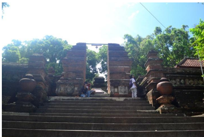
Gambar 1: Gapura Bentar berbahan bata merah yang tampak megah sebagai pintu gerbang menuju Makam Sultan Agung. Contoh penggunaan arsitektur Jawa Hindu pada makam Islam di Situs Makam Imogiri..

Situs Makam Imogiri lebih dikenal masyarakat setempat dengan nama Pajimatan. Kata ' pajimatan ' berasal dari Bahasa Jawa Baru yang artinya 'tempat jimat' atau 'tempat pusaka'. Kutipan teks dalam bahasa Jawa baru tentang hal tersebut terdapat pada Babad Momana yang dinyatakan dengan " Angka 1567, tahun Dal, dadosipun Antakapura ing redi Merak, kaparingan nama ing Pajimatan " ( Anonim, n.d. , hal. 18). Kutipan tersebut menunjukkan bahwa makam bagi Sultan Agung di Gunung Merak itu dipercaya memiliki kekuatan magis dan sakral. Hal tersebut dapat dikatakan sebagai konstruksi intelektual yang dibentuk untuk memenuhi kebutuhan manusia terhadap hal-hal yang bersifat religius ( Tuan, 1977 , hal. 100).