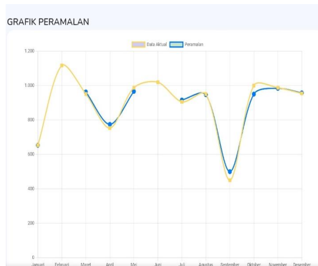
Gambar 4. Grafik peramalan

Mean Absolute Percentage Error (MAPE) menghitung kesalahan absolut untuk setiap periode dan membaginya dengan nilai observasi aktual untuk periode tersebut. Kemudian rata-ratakan persentase kesalahan absolutnya. Pada tahap pengujian terlihat bahwa metode Single Exponential Smoothing memerlukan perbandingan untuk menentukan nilai alpha terendah. Oleh karena itu, hasil alpha terendah dari perhitungan diatas adalah alpha 0,9 dan hasil MAPE sebesar 2,379% dan perkiraan penjualan selanjutnya adalah 905. Hasil dari proses peramalan tersebut ditunjukkan pada grafik yang ada pada system , di grafik terdapat hasil dari beberapa data aktual dan data peramalan dengan menggunakan alpha 0,9.