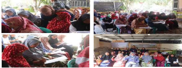
Gambar 11. Pengujian Pengetahuan Akhir ( Post-Test ) Warga Desa Pekon Kedaung Pringsewu Sebelum Menerima Ceramah Edukasi

Pengetahuan sebelum edukasi diukur melalui pre-test , sementara pengetahuan setelah edukasi diukur melalui post-test . Jika terjadi peningkatan yang signifikan dalam hasil post-test dibandingkan dengan pre-test , itu menunjukkan keberhasilan edukasi atau penyuluhan (Astuti et al., 2020; Tarigan et al., 2022).