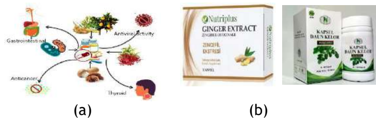
Gambar 4. (a) Fungsi dari Nutraceutical selain sebagai obat juga untuk kesehatan berperan sebagai sumber pangan yang memberi nutrisi tubuh; (b) Beberapa produk komersial Nutraceutical untuk pengobatan

Sehingga dapat disimpulkan bahwa nutrasetikal adalah produk hasil isolasi (tumbuhan, hewan, dan mikroba) yang mampu memberikan nutrisi dengan efek meningkatkan kesehatan tubuh (McClements et al., 2015b). Dalam bidang pengobatan, menggunakan nutrasetikal sudah mulai dipertimbangkan untuk menunjang proses terapi. Nutrasetikal yang digunakan umumnya berasal dari tumbuhan karena memiliki banyak kandungan dengan peran dan fungsi berbeda. Indonesia adalah pasar nutrasetikal penting di dunia ditandai dengan banyaknya produk-produk nutrasetikal yang ada di pasar nasional yang berasal dari produk impor maupun produk lokal. Penelitian yang mendukung pengembangan produk nutrasetikal di Indonesia juga sudah mulai berkembang, sementara bahan baku untuk produk-produk nutrasetikal sangat banyak di Indonesia.