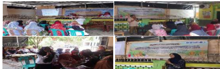
Gambar 8. Penyuluhan kegiatan PKM yang dilakukan secara offline dengan metode ceramah yang diikuti dengan diskusi yang interaktif

Penyuluhan kegiatan Program Kreativitas Mahasiswa (PKM) dilakukan dengan menggunakan metode ceramah, sosialisasi, dan edukasi ilmiah yang bertujuan untuk memberikan pemahaman mendalam kepada masyarakat