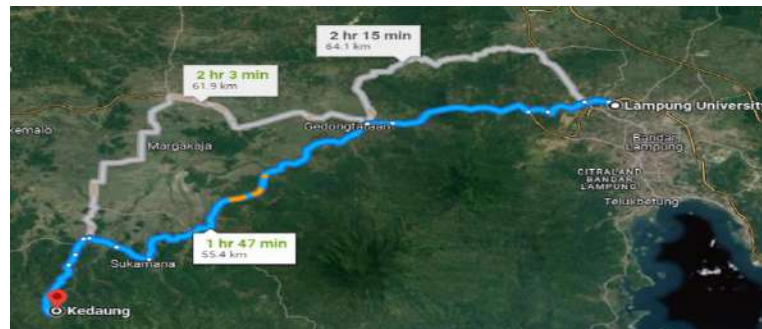
Gambar 2. Jarak antara lokasi kegiatan pengabdian (Pekon Kedaung) dengan Universitas Lampung yaitu 39.6 km yang ditempuh selama 1 Jam 47 menit