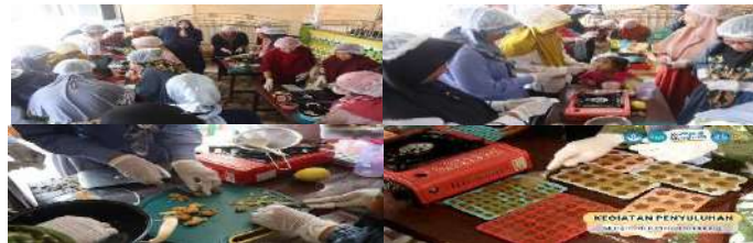
Gambar 9. Proses Pendampingan pembuatan Nutraceutical Gummy Candy dari Jahe Gajah

Proses pembuatan nutraceutical gummy candy dari jahe gajah dimulai dengan langkah pertama, yaitu mencuci, mengupas, dan merajang jahe secara teliti. Jahe yang telah dirajang kemudian dicampur dengan 400 ml air dan direbus hingga mencapai titik didih. Setelah proses merebus, rebusan jahe disaring untuk menghilangkan ampasnya, dan air hasil saringan tersebut ditambahkan dengan gula sebagai pemanis yang sesuai, perasa lemon, dan gelatin (Afrenthy et al., 2014; Manurung et al., 2018; Rusli, 2018).