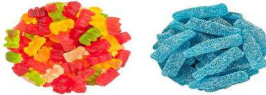
Gambar 5. Gummy Candy dengan warna dan rasa menarik

ditutupi dengan efektif, bentuknya yang menarik dan tekstur yang menyenangkan karena kenyal (Amaria et al., 2016).