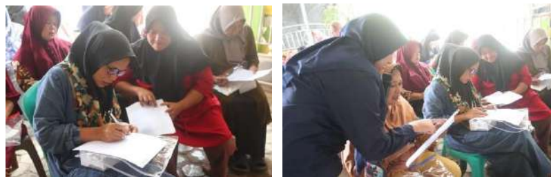
Gambar 7. Pengujian Pengetahuan Awal ( Pre-Test ) Warga Desa Pekon Kedaung Pringsewu Sebelum Menerima Ceramah Edukasi

Sejumlah 30% atau 15 orang dari responden mengetahui bahwa jahe berasal dari rimpang tanaman jahe, tetapi kebanyakan dari mereka masih memerlukan pemahaman lebih mendalam tentang sifat-sifat rimpang dan potensinya sebagai bahan nutraceutical. Meskipun sekitar 20%, atau sepuluh orang, pernah menggunakan jahe untuk pengobatan tradisional seperti demam, batuk, asma, dan sebagainya, hanya sedikit yang memahami potensi nutraceutical yang terkandung di dalamnya.