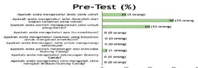
Gambar 6. Nilai Persentase (%) Pengetahuan sebelum ( Pre-Test ) Warga Desa Pekon Kedaung Pringsewu Sebelum Menerima Ceramah Edukasi

Sebelum memulai pengembangan produk nutraceutical dari jahe di Desa Pekon Kedaung, sebuah pre-test dilaksanakan untuk mengukur pengetahuan awal masyarakat (Hamzah, 2020) terkait manfaat jahe dan potensinya dalam pengembangan produk nutraceutical. Dalam pre-test ini, 50 warga desa terlibat sebagai responden.