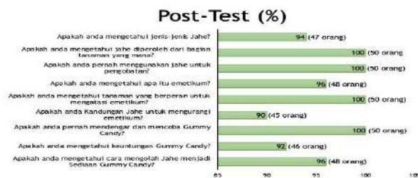
Gambar 10. Nilai Persentase (%) Pengetahuan setelah ( Post-Test ) Warga Desa Pekon Kedaung Pringsewu Sebelum Menerima Ceramah Edukasi

Hasil dari post-test setelah edukasi dan pendampingan menunjukkan perubahan yang signifikan dalam pengetahuan masyarakat Desa Pekon Kedaung terkait manfaat jahe serta pengembangan produk turunannya, khususnya Gummy Candy . Dari total 50 warga yang terlibat dalam kegiatan pengabdian, pengetahuan tentang jenis-jenis jahe meningkat secara luar biasa, mencapai 94% atau 47 orang yang kini memiliki pemahaman yang jauh lebih luas tentang varietas jahe. Seluruh 50 warga, atau 100% dari responden, kini memahami bahwa jahe diperoleh dari rimpang tanaman jahe, menandakan keberhasilan dalam menyampaikan informasi tentang sifat asal jahe kepada seluruh komunitas.