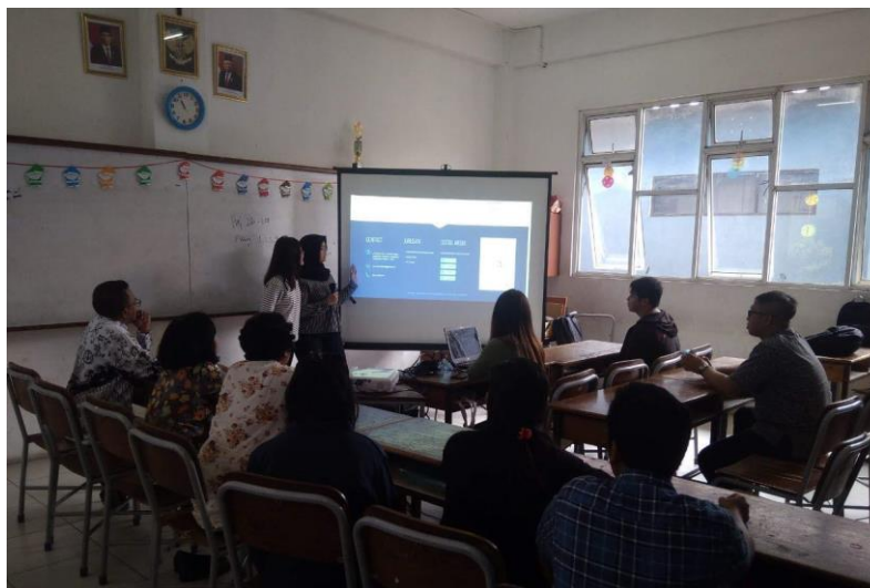
Gambar 3. Diskusi terhadap Sistem Informasi yang Berjalan

Gambar 3 merupakan suasana disaat tim PkM yang diwakili oleh mahasiswa dan didampingi oleh dosen dalam memaparkan temuan awal atas kebutuhan yang sudah disampaikan oleh Kepala Sekolah. Pada Gambar 3 tersebut, terlihat suasana diskusi selain dihadiri oleh tim PkM, juga dihadiri oleh para guru dan bagian yang terlibat atas proses bisnis keseharian yang berjalan di SMK Maria Mediatrix.