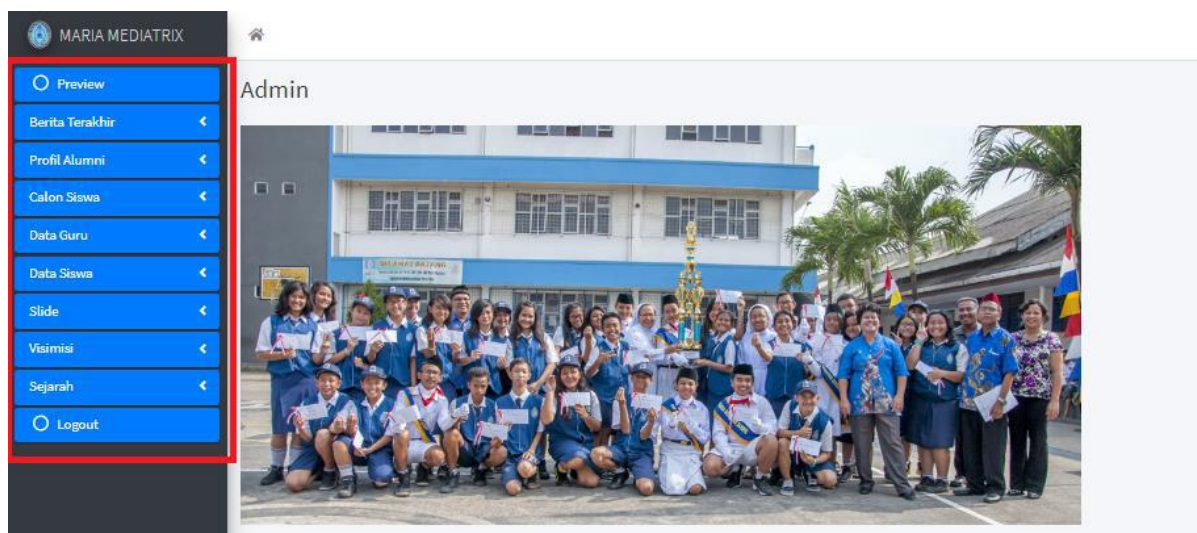
Gambar 5. Tampilan Halaman Utama Antarmuka Pengguna

Gambar 5 diatas merupakan laman utama dari antar muka pengguna. Dimana dari laman pada Gambar 5 terlihat ada 10 fitur dari aplikasi backend yang tersaji dalam bentuk menu. Menu yang bisa diakses oleh pengguna terdiri dari preview yang akan menyajikan tampilan-tampilan foto dan/atau pengumuman, pendataan berita, profile alumni, calon siswa, data guru, data siswa, foto-foto untuk ditampilkan pada layar preview /utama, visi dan misi, sejarah, serta logout.