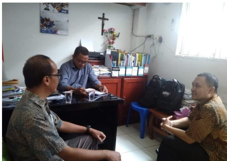
Gambar 2. Diskusi Permasalahan dan Kebutuhan Informasi

Setelah kunjungan pertama tersebut, team pelaksana PkM secara intensif melakukan kunjungan-kunjungan berikutnya. Proses kunjungan dalam rangka pengumpulan data telah dilaksanakan selama tiga minggu berturut-turut, yaitu dalam satu minggunya dilaksanakan sebanyak tiga hari kerja, dan masing-masing kunjungan tersebut dilaksanakan selama kurang lebih empat jam.