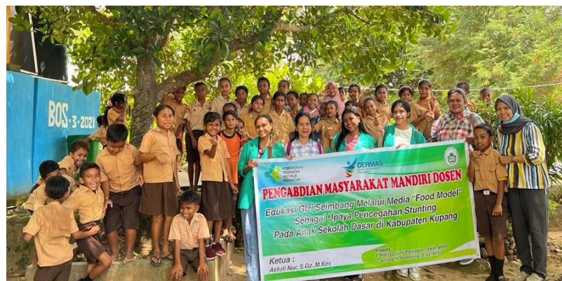
Gambar 5. Foto Bersama