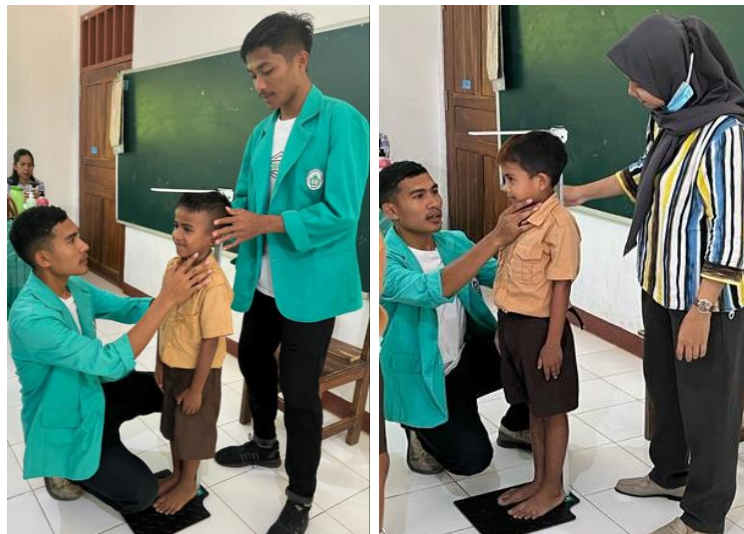
Gambar 2. Pengukuran tinggi badan siswa

Tabel 3 menunjukkan bahwa sebagian besar siswa memiliki status gizi (TB/U) tergolong normal (71,2%). Namun terdapat 19% yang pendek dan 9,2% yang sangat pendek.