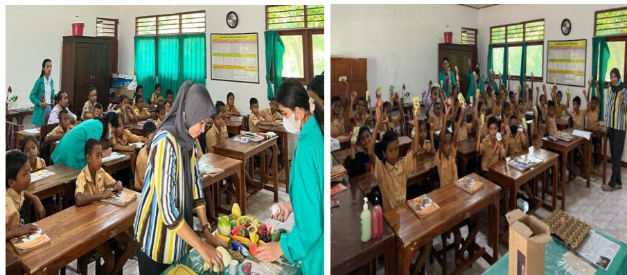
Gambar 4. Edukasi gizi seimbang dan pemberian PMT

Dari gambar 1 di atas dapat diketahui bahwa terjadi peningkatan pengetahuan setelah pemberian edukasi gizi seimbang menggunakan media food model. Sebelum pemberian edukasi, siswa yang menjawab pertanyaan dengan benar sebanyak 54% dan mengalami peningkatan menjadi 78% setelah mendapatkan edukasi.