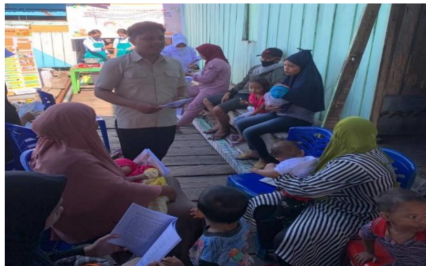
Gambar 2. Pemberian Edukasi

Kemudian dilanjutkan dengan membagikan buku saku Temulawak dan pemaparan materi edukasi. Adapun materi yang disampaikan yaitu Pengertian Temulawak, Kandungan Temulawak, Manfaat Temulawak untuk Kesehatan, Cara Pembuatan Minuman Kesehatan Temulawak dan Cara mengonsumsi Minuman Kesehatan Temulawak.