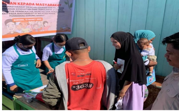
Gambar 3. Demonstrasi pembuatan minuman kesehatan temulawak

Setelah itu simulasi yaitu masyarakat mempraktikkan kembali secara langsung membuat Minuman Kesehatan Temulawak sambil didampingi oleh tim pengabdian.