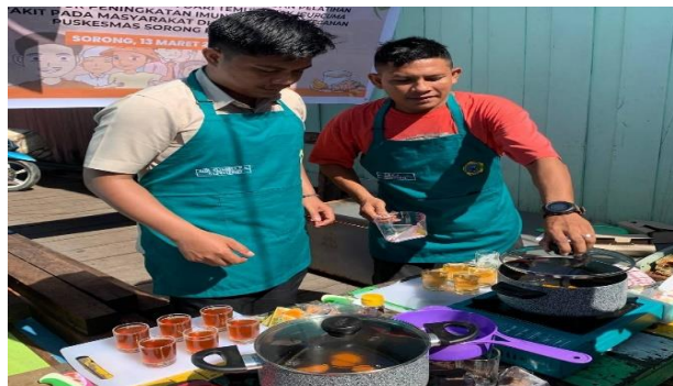
Gambar 4. Simulasi membuat Minuman Kesehatan Temulawak bersama masyarakat

Setelah itu simulasi yaitu masyarakat mempraktikkan kembali secara langsung membuat Minuman Kesehatan Temulawak sambil didampingi oleh tim pengabdian.