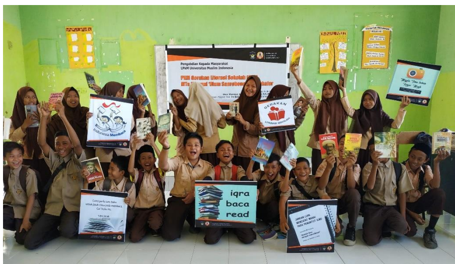
Gambar 2. Suasana Penerapan Program Gerakan Literasi Sekolah

Pembiasaan yang telah diterapkan ini merupakan upaya menumbuhkan motivasi dalam diri para santri asgar gemar membaca yang ditunjang oleh lingkungan sekolah dan keluarga yang mendukung. Hal ini sejalan dengan Faradina (2017) bahwa terdapat dua faktor yang berpengaruh dalam meningkatkan minat baca peserta didik, yakni faktor internal dan eksternal. Faktor internal berasal dari dalam diri peserta didik, seperti pembawaan, kebiasaan, dan ekspresi diri, sedangkan faktor eksternal berasal dari luar diri peserta didik atau faktor lingkungan, baik lingkungan keluarga, tetangga, maupun lingkungan sekolah.