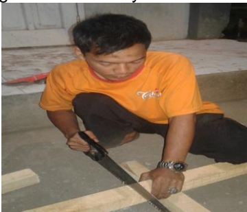
Gambar 4. Alat dan Ukuran Perontok Padi

Bahan-bahan yang sudah di siapkan, diantaranya balok kayu, triplek, reng kayu di potong sesuai ukurannya.