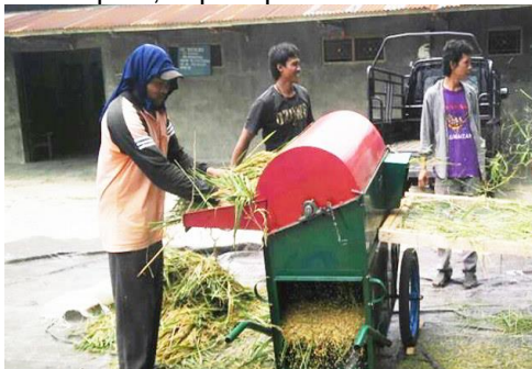
Gambar 2. Merontokkan Padi Dengan Mesin Mesin Power Thresher (Mesin Perontok Padi) adalah jenis mesin perontok yang telah terbukti handal dan sangat cocok dengan berbagai jenis lahan persawahan di Indonesia. Alat dan mesin pertanian (mesin

perontok padi) dapat memberi kontribusi yang cukup berarti dalam rangka meningkatkan keuntungan usaha tani padi sawah. Unsur-unsur yang mendukung peningkatan keuntungan adalah kecepatan proses perontokan dan pembersihan sehingga menghemat waktu. Lebih penting lagi power thresher terbukti dapat mengurangi kehilangan gabah saat perontokan dan mengurangi kerusakan (pecah) butir gabah sehingga petani memperoleh nilai tambah dalam usaha taninya, selain itu mempunyai kelebihan yang lain yaitu :