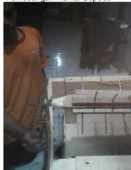
Gambar 6. Pemasangan Rantai Sepeda b. Alat siap digunakan