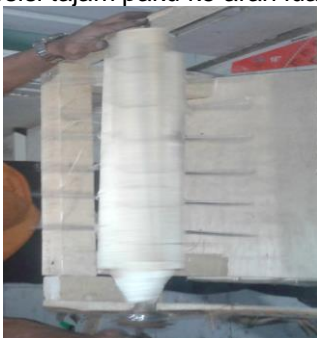
Gambar 5. Perakitan Reng Kayu dengan Paku

Gigi ini di buat dari sebuah balok kayu dan reng kayu dengan ukuran panjang 40 cm di balok kayu ini di beri reng kayu yang sudah sudah di rakit, dengan paku ukuran 10 cm sebanyak 40 buah paku dengan jarak 2 cm dan posisi tajam paku ke arah luar.