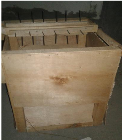
Gambar 7. Alat Perontok Padi