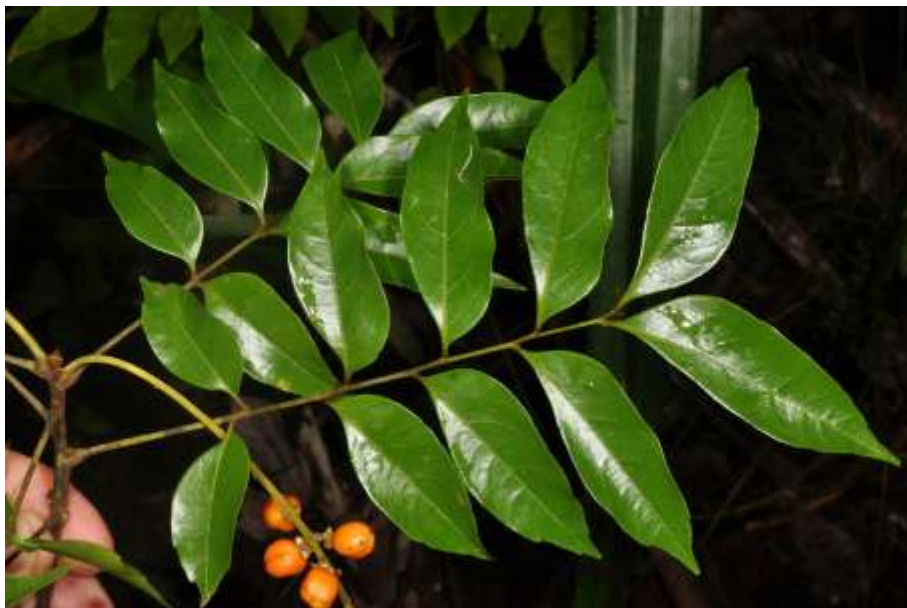
Gambar 1. Daun dan buah Dictyoneura acuminata Blume