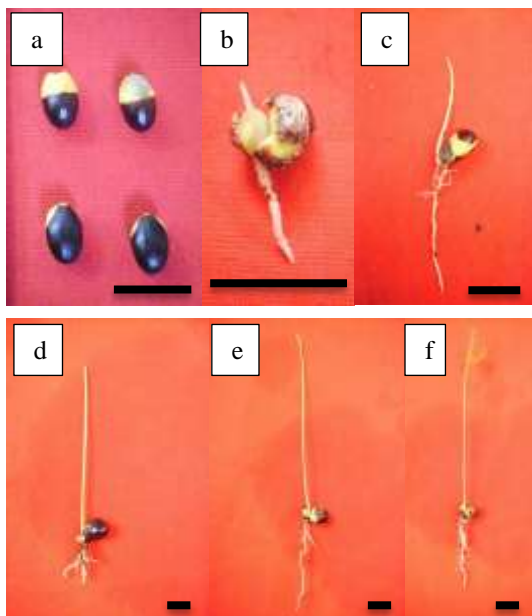
Gambar 3. a) Biji D. acuminata ; Proses perkecambahan D. acuminata b) Biji pecah tumbuh radikel dan epikotil (3-5 hari), c) Radikel dan epikotil mulai memanjang (5-7 hari), d) bakal daun mulai muncul (7-10), e) kuncup daun muncul (10-14 hari), f) daun membuka (24-26 hari) (skala 1 cm)