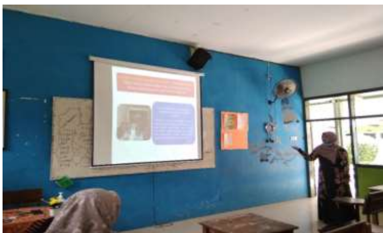
Gambar 4. Edukasi prinsip kehati-hatian (isrof) dalam mengkonsumsi makanan halal

Pada sesi selanjutnya, tim pelaksana membuka kegiatan diskusi berkaitan dengan materi yang disampaikan. Sebagain besar guru-guru agama banyak yang mengajukan beberapa pertanyaan mengenai proses sertifikasi halal bagi produk. Adapula yang bertanya terkait kiat-kiat dalam memilih produk besertifikasi halal dengan produk yang non halal. Sebagian besar guru berpendapat jika kesadaran halal di lingkungan sekolah menjadi peran besar bagi pihak sekolah. Kegiatan ini diakhiri dengan foto bersama antara tim pelaksana dengan peserta kegiatan pengabdian yang dapat dilihat pada gambar 5.