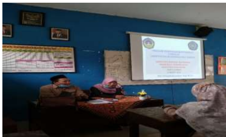
Gambar 2. Sambutan Pihak Sekolah MAN 2 Jember tentang Pentingnya Kesadaran Masyarakat akan Menkonsumsi Produk Halal

Untuk kegiatan selanjutnya, maka tim pelaksana sekaligus sebagai pemateri mulai menjelaskan sosialisasi gerakan masyarakat sadar halal bagi dunia pendidikan yang ditampilkan dalam bentuk presentasi Power point. Pada materi pertama, pemateri menjelaskan berkaitan dengan landasan hukum industry halal di Indonesia yang tertuang dalam beberapa peraturan perundang-undangan sebagai berikut: