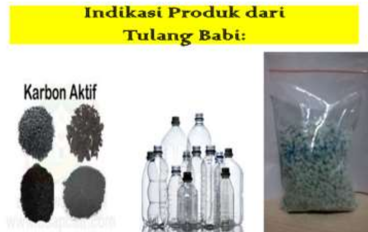
Gambar 3. Penggunaan Arang Aktif Sebagai Filter Yang Berasal Dari Tulang Babi