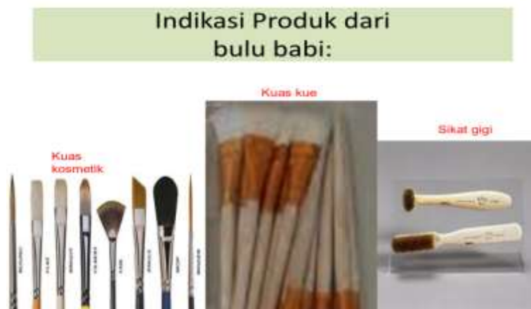
Gambar 4. Penggunaan Kuas yang Terindikasi Dari Bulu Babi