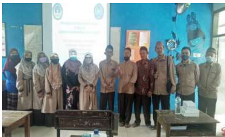
Gambar 5. Kegiatan Foto Bersama setelah Kegiatan Sosialisasi

Pada sesi selanjutnya, tim pelaksana membuka kegiatan diskusi berkaitan dengan materi yang disampaikan. Sebagain besar guru-guru agama banyak yang mengajukan beberapa pertanyaan mengenai proses sertifikasi halal bagi produk. Adapula yang bertanya terkait kiat-kiat dalam memilih produk besertifikasi halal dengan produk yang non halal. Sebagian besar guru berpendapat jika kesadaran halal di lingkungan sekolah menjadi peran besar bagi pihak sekolah. Kegiatan ini diakhiri dengan foto bersama antara tim pelaksana dengan peserta kegiatan pengabdian yang dapat dilihat pada gambar 5.