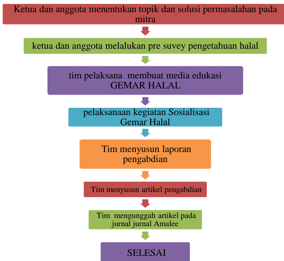
Gambar 1. Tahapan Pelaksanaan Kegiatan Pengabdian

Untuk lebih jelasnya, maka pelaksanaan pengabdian ini dapat dilihat pada gambar