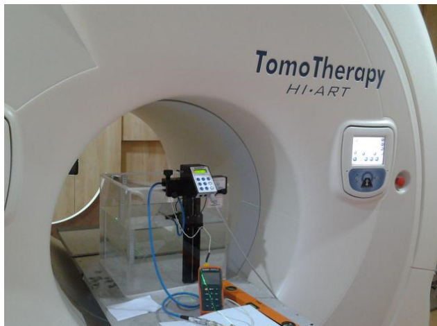
Gambar 3. Susunan peralatan pada pengukuran keluaran berkas foton 6 MV dari pesawat tomoterapi helik pada kondisi statik dengan jarak sumber radiasi ke permukaan fantom air 85 cm, lapangan radiasi di permukaan fantom air 5 cm x 10 cm dan kedalaman detektor 10 cm

Setelah dilakukan pengukuran Persentase Dosis di Kedalaman berkas radiasi foton maka dilakukan pengukuran luaran berkas radiasi foton 6 MV dengan kondisi penyinaran statik. Pengukuran dilakukan di dalam fantom air menggunakan sistem dosimeter Webline. Pengukuran dilakukan pada kedalaman 10 cm dengan jarak sumber radiasi ke permukaan fantom 85 cm dan lapangan radiasi pada permukaan 5 cm x 10 cm. Pertama dilakukan pemanasan dosimeter yang digunakan selama beberapa menit, selanjutnya dilakukan penyinaran pendahuluan untuk 5 menit penyinaran. Setelah itu dilakukan penyinaran untuk waktu 1 menit pesawat. Pengambilan data dilakukan sebanyak 5 buah untuk keperluan pengukuran faktor-faktor koreksi rekombinasi ion, efek polaritas dan luaran. Temperatur dan tekanan udara selama pengukuran diamati. Susunan peralatan pada pengukuran tersebut dapat dilihat pada Gambar 3.