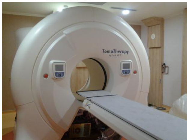
Gambar 1. Pesawat Tomoterapi Hi Art

Makalah ini menguraikan penentuan laju dosis serap air dari pesawat helikal tomo terapi Hi Art yang dilakukan di Rumah Sakit Umum Pusat Nasional Dr. Cipto Mangun kusumo, Jakarta.