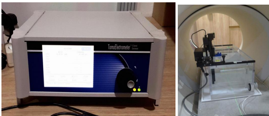
Gambar 2. Detektor ionisasi Exradin A1SL, elektrometer Tomo dan fantom air yang digunakan dalam pengukuran persentase dosis di kedalaman

Sebagai alat ukur radiasi untuk pengukuran persentase dosis di kedalaman digunakan detektor volume 0.056 cc Exradin A 1SL buatan Standard Imaging yang dihubungkan dengan elektrometer TomoElektrometer. Dalam pengukuran detektor ionisasi diletakkan dalam fantom air berukuran 40 cm x 25 cm x 25 cm. Detektor ionisasi A1SL, elektrometer TomoElektrometer dan fantom air dapat dilihat pada Gambar 2 di bawah ini.