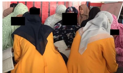
Gambar 3. Assessment