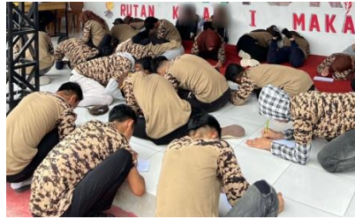
Gambar 1. Assessment