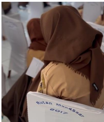
Gambar 7. Posttest

Dari hal ini diperoleh fakta, sebagian besar Warga Binaan Pemasyarakatan merasa telah mendapatkan dampak bangkit dari keterpurukan dan 3 Warga Binaan Pemasyarakatan belum mengetahui dampak bangkit dari keterpurukan. Dengan meningkatkan resiliensi dapat memberikan individu pengalaman dalam menghadapi dan kesulitan hidup 10 . Hal ini sejalan dengan penelitian Faradiah et al. (2021), manfaat positif dari resiliensi adalah dapat mengurangi stress, peningkatan kemampuan beradaptasi pada individu, dan pengembangan keterampilan coping yang lebih baik untuk mengatasi perubahan dan kesulitan 11 . Hasil dari rangkaian program seminar edukasi ini adalah Warga Binaan Pemasyarakatan yang awalnya belum mengetahui terkait resiliensi, dan setelah diberikan pemaparan materi mengalami perubahan yaitu terjadi peningkatan pengetahuan Warga Binaan Pemasyarakatan terkait resiliensi.