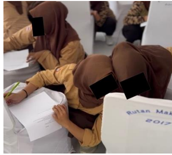
Gambar 8. Posttest