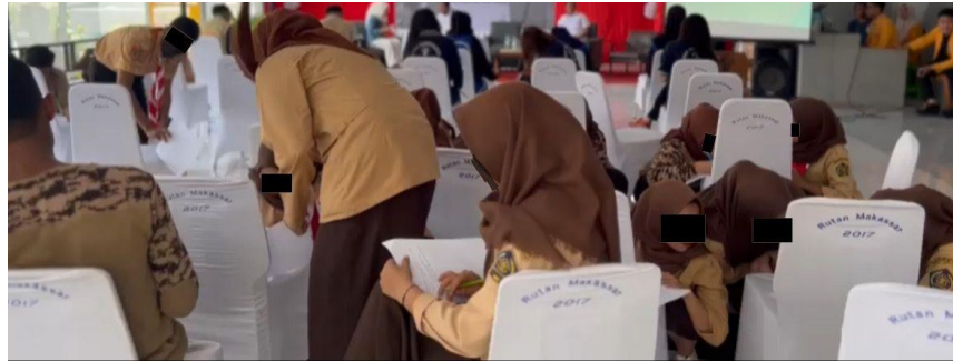
Gambar 4. Pretest

Dari hal ini diperoleh fakta, sebagian besar Warga Binaan Pemasyarakatan masih belum tahu cara untuk bangkit dari keterpurukan dan sebagian kecil sudah memiliki cara sendiri untuk bangkit dari keterpurukan.