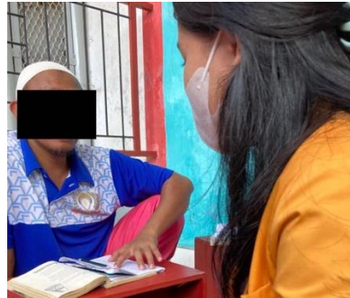
Gambar 2. Assessment