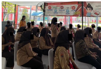
Gambar 6. Warga Binaan Pemasyarakatan Bertanya kepada Pembicara