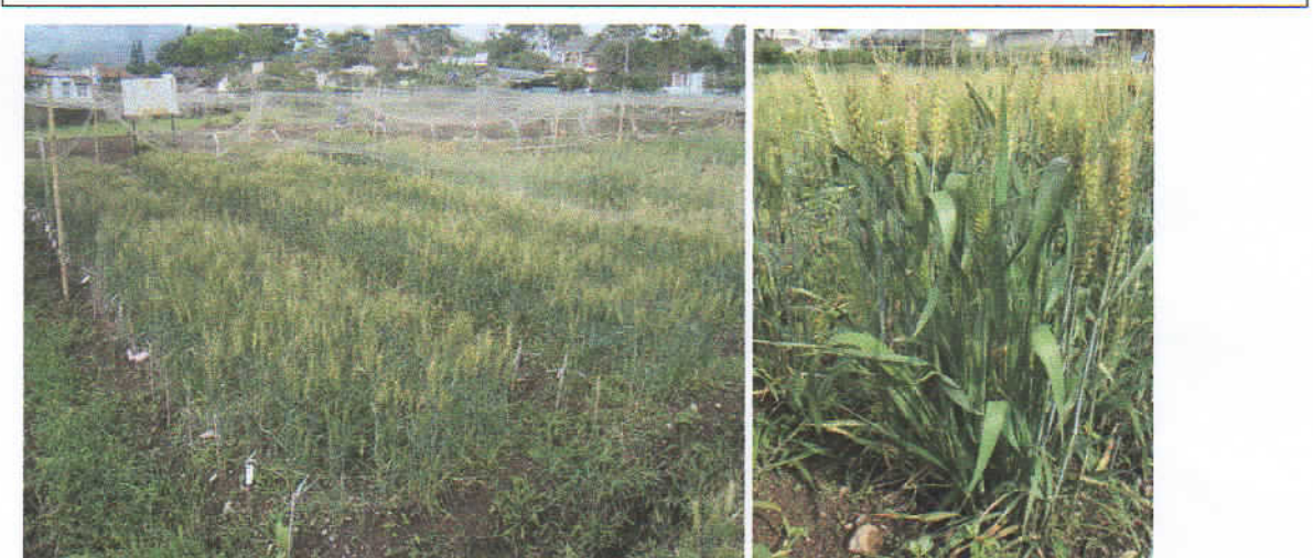
Gambar 5. Contoh kegiatan penelitian gandum seleksi M3 dan salah satu galur mutan yang terseleksi lebih baik dari tetuanya