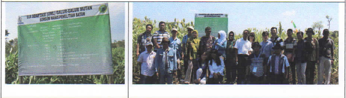
Gambar 3. Uji adaptasi sorgum manis di Playen Gunungkidul, Yogyakarta