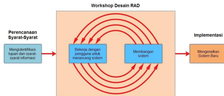
Gambar 1. Desain RAD

Dalam pengembangan sistem informasi normal, memerlukan waktu minimal 180 hari, namun dengan menggunakan metode RAD, sistem dapat diselesaikan dalam waktu 30-90 hari. Selain itu metode RAD melibatkan pengguna dalam proses pengembangan sehingga kebutuhan sistem dapat terpenuhi dengan baik dan sesuai dengan keinginan pengguna itu sendiri [7]. Terdapat 3 tahapan dari metode RAD seperti pada Gambar 1: