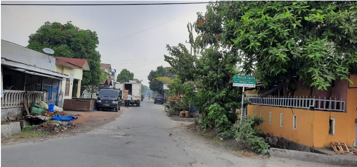
Gambar 1. Jalan Masjid Taufik, Kelurahan Tegal Rejo, Kecamatan Medan Timur