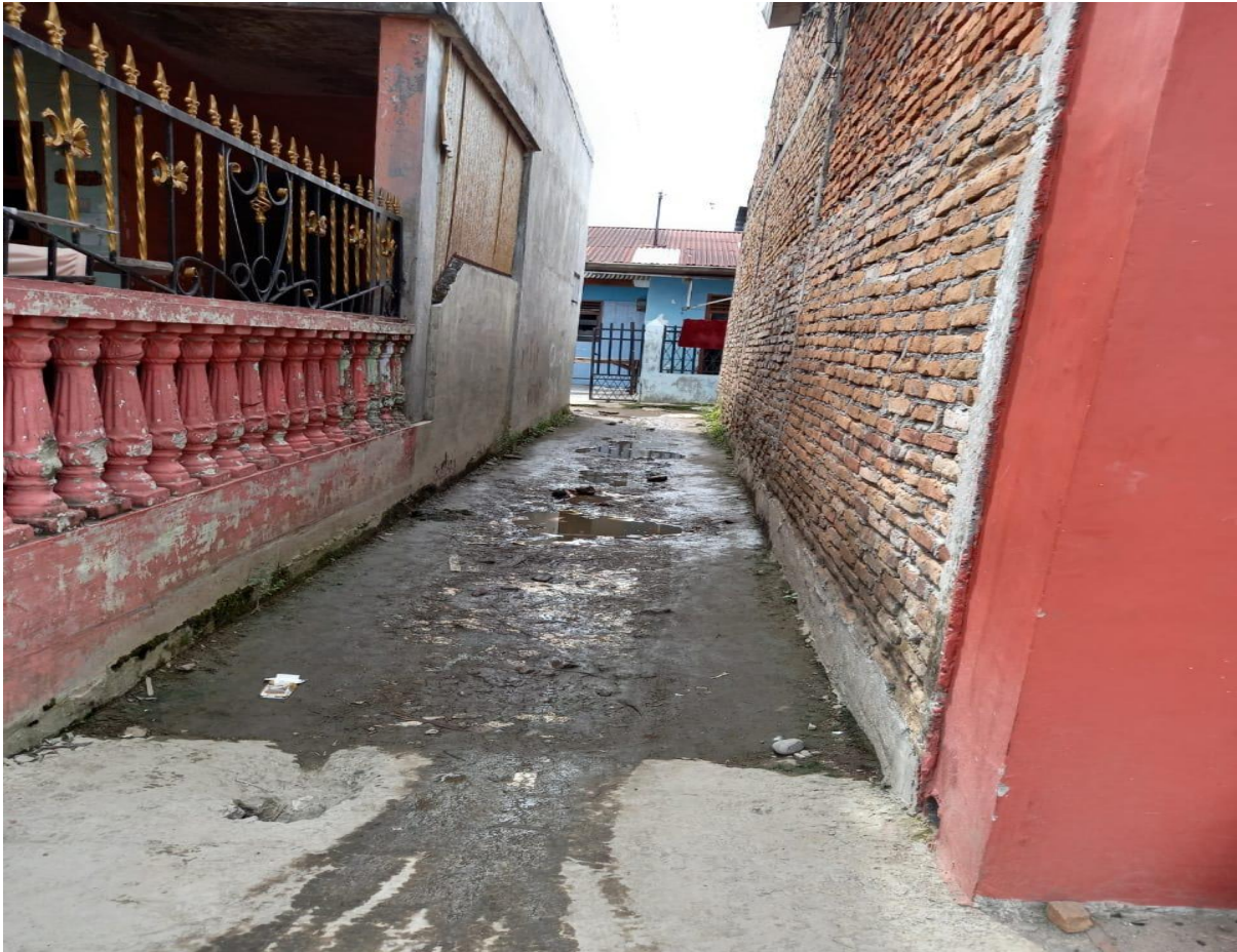
Gambar 4. Jalan tikus lainnya dalam Gang yang sempit juga sering menjadi tempat terjadinya aksi para penyalahguna narkoba.

Dalam usaha meningkatkan kesadaran kolektif masyarakat masyarakat Jalan Masjid Taufik, Kelurahan Tegal Rejo, Kecamatan Medan Perjuangan terhadap kebersihan lingkungan bebas narkoba di masa pandemi dengan metode-metode pengabdian untuk menyelesaikan permasalahan penyalahgunaan narkoba dengan melakukan pendidikan dan memberikan layanan informasi kepada Lurah Tegal Rejo Desa Tegal Rejo, Kecamatan Medan Perjuangan, Jalan Masjid Taufik dan Masyarakat tentang upaya pencegahan dan penanggulangan narkoba. Berikut ini adalah prosedur kerja yang mendukung program pelaksanaan Pengabdian antara lain: