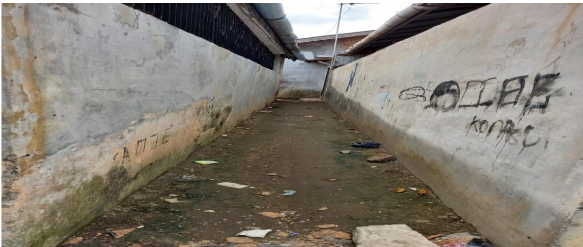
Gambar 3. Salah satu jalan tikus yang sempit sering menjadi tempat terjadinya aksi para penyalahguna narkotika

Ketika ditangkap dari saku celana tersangka ditemukan sisa narkoba. Dari tangan tersangka telah didapat sisa paket narkoba yang sudah digunakan di lokasi, tersangka ditangkap saat personel kepolisian menggelar razia karena melihat tersangka secara mendadak kabur, petugas langsung melakukan pengejaran.