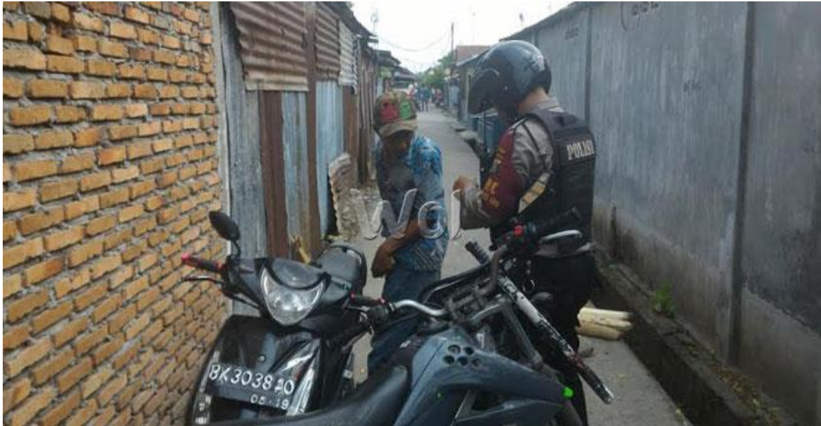
Gambar 2. Anggota Reserse Kriminal Polsek Medan Timur pada Senin, 3 Maret 2021, menggerebek markas narkoba di kawasan Jalan Masjid Taufik, Gang Samudera, Kecamatan Medan Perjuangan

Ketika ditangkap dari saku celana tersangka ditemukan sisa narkoba. Dari tangan tersangka telah didapat sisa paket narkoba yang sudah digunakan di lokasi, tersangka ditangkap saat personel kepolisian menggelar razia karena melihat tersangka secara mendadak kabur, petugas langsung melakukan pengejaran.