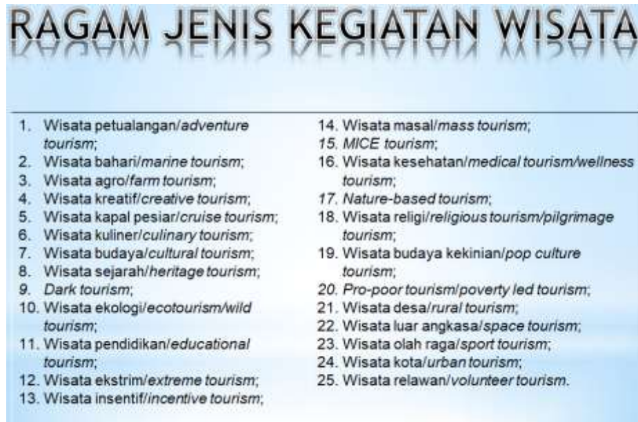
Gambar 2. Keanekaragaman Kegiatan Tempat Wisata

suatu daerah menjadi sumber daya pariwisata. Dengan kata lain, potensi wisata adalah kemampuan untuk mengembangkan berbagai sumber daya suatu tempat, dengan mempertimbangkan aspek lain, menjadi daya tarik wisata yang dimanfaatkan untuk tujuan ekonomi (Meyers, 2009). Pertimbangan dalam mengelola potensi sumber daya pariwisata harus dilakukan melalui survei, inventarisasi dan evaluasi sebelum fasilitas pariwisata dikembangkan (Bhatari, 2020).