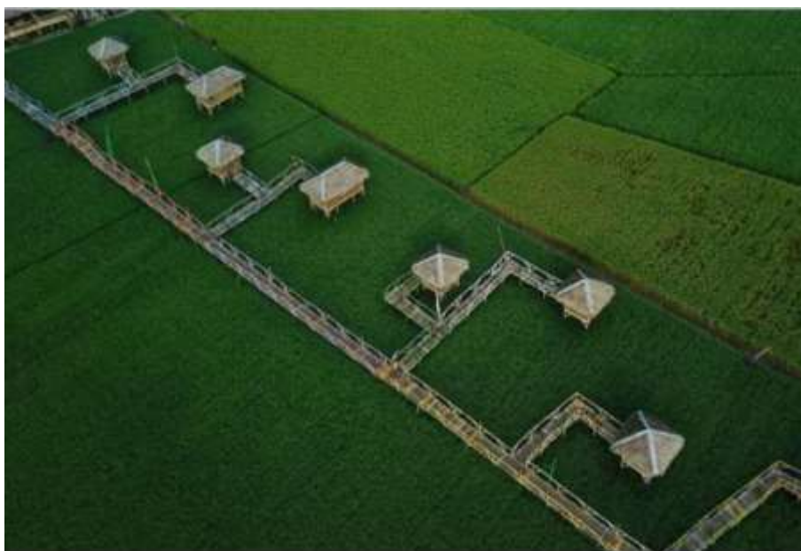
Gambar 3. Kawasan Wisata Pematang Johar

Adapun salah satu bentuk jenis kegiatan yang ada di Pematang Johar adalah Wisata agro dan dapat dilihat pada gambar 3 dibawah ini.