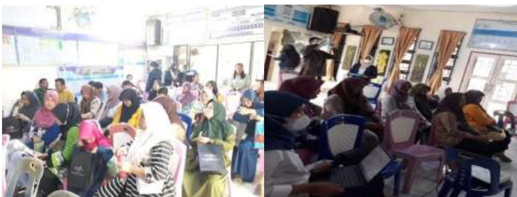
Gambar 3. Para peserta dengan tertib dan antusias mendengarkan pemaparan materi dan diskusi

Setelah itu, kami akan mempresentasikan materi dan melakukan kegiatan komunitas untuk bertanya. Para peserta sangat antusias. Hal ini juga terlihat dari pertanyaan-pertanyaan yang diajukan oleh para peserta karena mereka sangat termotivasi untuk memahami pinjaman online dan perdagangan digital.