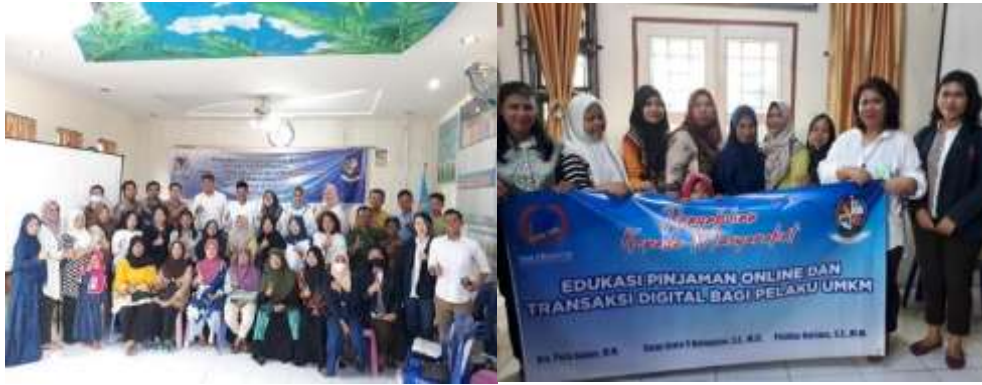
Gambar 4. Foto Bersama antara para akademisi STIE Eka Prasetya, para perangkat desa, dosen, mahasiswa, dan peserta PkM.