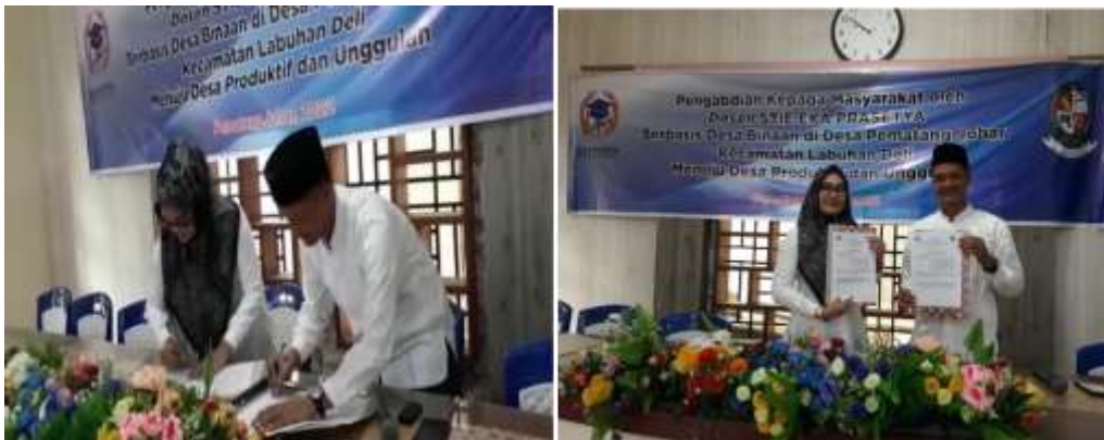
Gambar 2. Tanda Tangan MOU antara Ketua STIE Eka Prasetya dengan Kepala Desa Pematang Johar. Desa Pematang Johar sebagai Desa Binaan STIE Eka Prasetya.

Pinjaman online adalah pinjaman yang ditawarkan oleh penyedia layanan keuangan berbasis online (digital), dan pengguna dari fasilitas pinjaman berbasis digital ini perlu di edukasi kepada para UMKM desa Pematang Johar melalui program pengabdian kepada masyarakat. Pelaksanaan kegiatan diawali kata sambutan dari Ketua STIE Eka Prasetya, dan dilanjutkan penanda tangan MOU antar Ketua STIE Eka Prasetya dan Kepala Desa Pematang Johar. Dan hasil kerjasama yang sudah disepakati desa Pematang Johar yang terletak di Kecamatan Medan Deli merupakan Desa Binaan STIE Eka Prasetya dengan harapan kedepannya desa Pematang Johar menjadi desa produktif dan unggul.