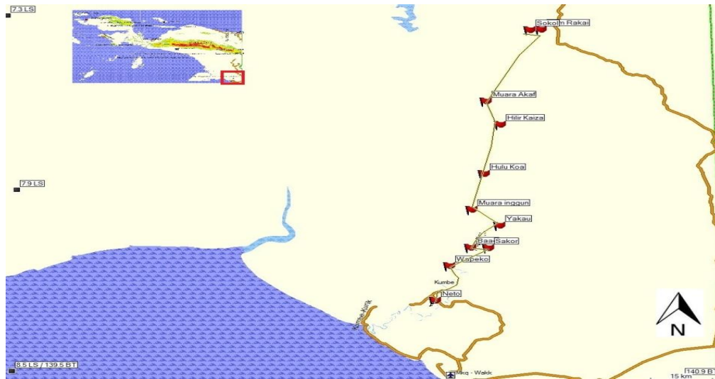
Gambar 1. Lokasi penelitian Sungai Kumbe