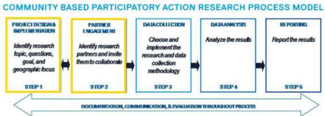
Gambar 1. Tahapan Metode CBPAR

Community based dalam pengabdian kepada masyarakat ini yaitu SD Yayasan Perguruan Amaliyah Sunggal, participatory yaitu guru-guru SD Yayasan Perguruan Amaliyah Sunggal, dan action based and oriented yaitu meningkatkan kemampuan guru membuat video penjelasan materi pembelajaran sebagai media pembelajaran siswa.