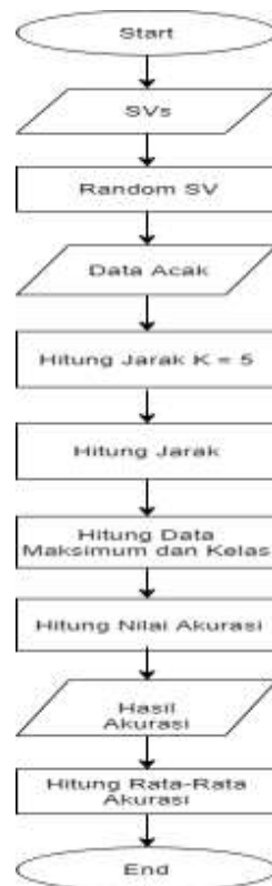
Gambar 2 K-Fold Cross Validation

K-Fold Cross Validation digunakan untuk mengetahui tingkat akurasi dari masing-masing perusahaan yang terlibat. Ada beberapa langkah cara kerja dari K-Fold Cross Validation untuk menentukan akurasi dari masing-masing data perusahaan saham, yaitu menentukan banyak nilai K, merandom data set, membagi partisi pada data training dan data testing, kemudian menentukan akurasi dari nilai K. Tahapan untuk mengetahui tingkat akurasi dengan K-Fold Cross Validation dapat dilihat pada gambar 2 di atas.