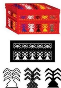
Gambar 1. Motif Kelapa

Motif kelapa ini memiliki ornamen utama yang terinspirasi dari tumbuhan kelapa yang merupakan salah satu hasil alam terbesar di Sulawesi Utara. Ornamennya berbentuk pohon kelapa dengan enam helai daun kelapa, yang dibuat melalui proses stilasi.