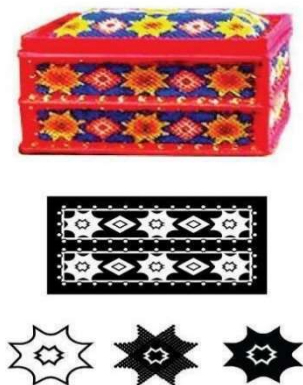
Gambar 3. Motif Floral

Motif Floral Ornamen pada motif ini menjadikan bunga sebagai objek inspirasi, yang terdiri dari beberapa jenis bunga yaitu, bunga matahari, bunga anggrek, bunga melati.