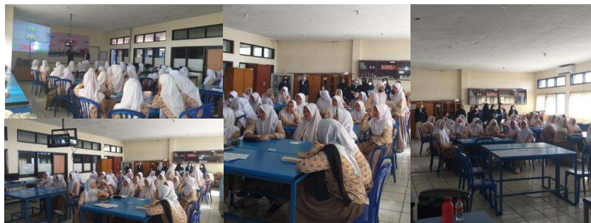
Gambar 2. Pelaksanaan kegiatan edukasi

Kegiatan edukasi dan sosialisai tentang “Cegah Kanker Payudara Sejak Dini dengan melakukan SADARI”. Kegiatan pendidikan kesehatan ini dihadiri oleh 48 orang siswa SMA AL Masoem, akitivitas ini melibatkan 5 mahasiswa semester 3 dari Fakultas Keperawatan Universitas Padjadjaran. Mayoritas Siswa berusia 15-17 tahun. Berikut gambar kegiatan ketika edukasi dilaksanakan: