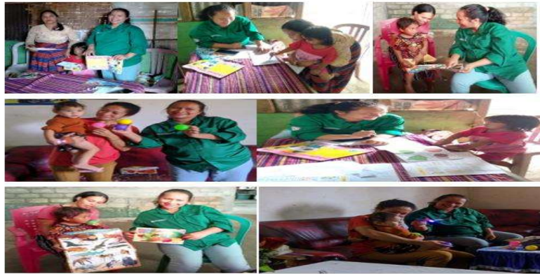
Gambar 4. Foto kegiatan pendampingan door to door