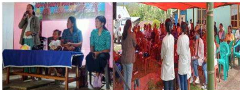
Gambar 3. Foto kegiatan penyuluhan di desa Lentang Kec. Lelak

Tabel Post test diperoleh hasil : berpengetahuan baik sebanyak 19 Orang (70,38%), berpengetahuan cukup sebanyak 5 Orang (18,51%), berpengetahuan kurang sebanyak 3 Orang (11,11 %).