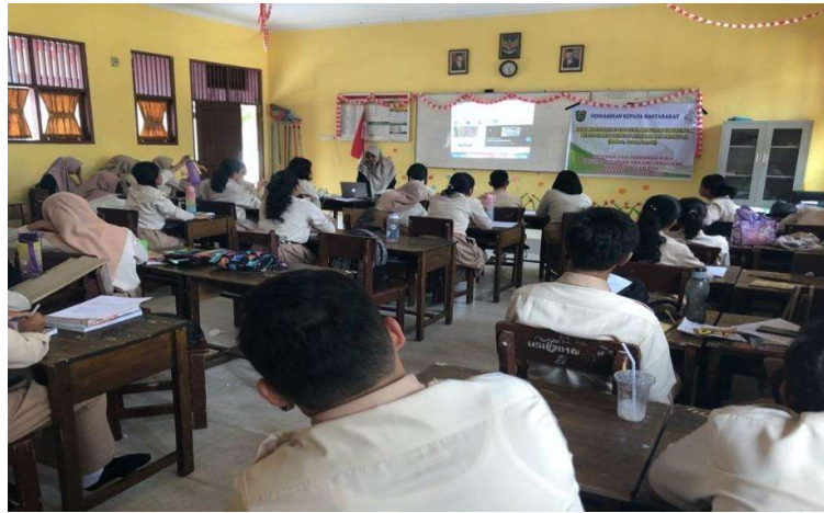
Gambar 3. Kondisi Peserta Kegiatan PkM

membawa minum menggunakan botol yang dapat diisi ulang. Namun masih ada juga siswa yang membeli minuman dalam wadah sekali pakai.