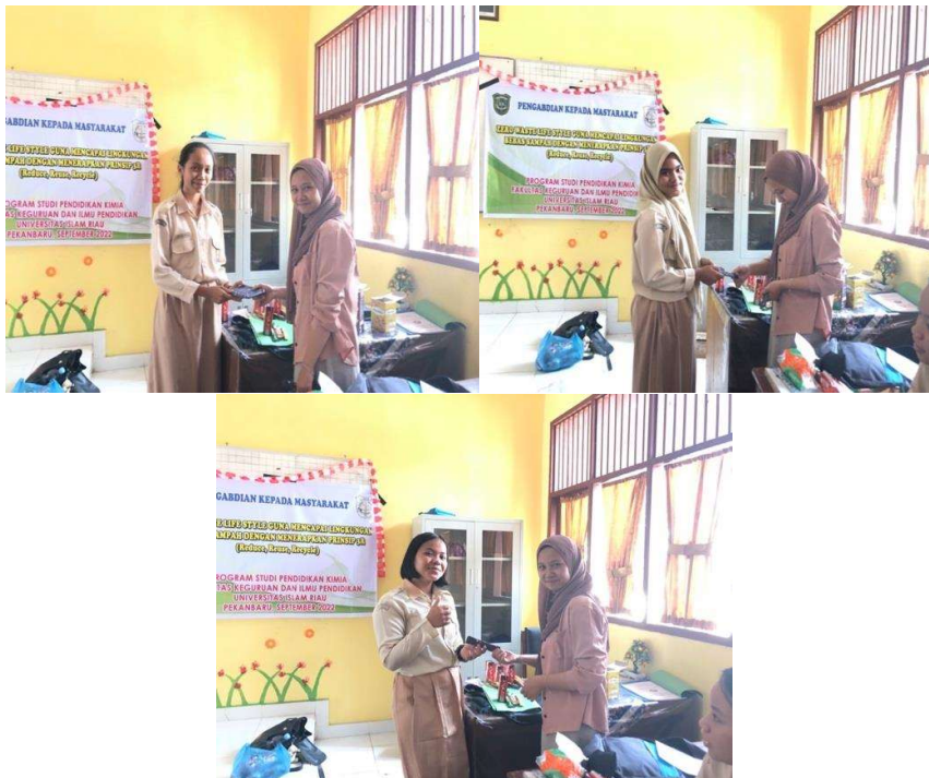
Gambar 4. Pemberian Hadiah Pemenang Kuis

Kegiatan PkM ini dilakukan lebih kurang 2 jam pelajaran, dimana di akhir kegiatan para siswa diberikan kuis terkait materi yang telah dibahas menggunakan platform Quizizz . Tujuan diadakannya kuis ini adalah sebagai bentuk evaluasi terhadap kegiatan yang telah dilakukan. Berdasarkan nilai yang diperoleh, dipilihnya tiga orang siswa yang jawabannya hampir sempurna dan masing-masing siswa tersebut diberikan hadiah yang telah disiapkan sebelumnya oleh tim PkM.