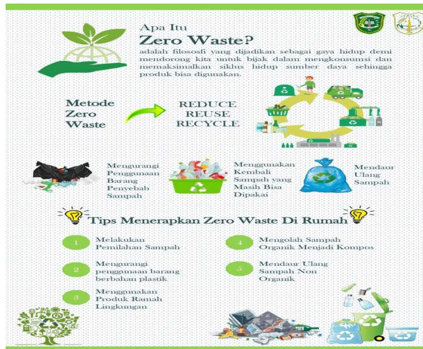
Gambar 2. Poster Zero Waste Life Style

Kegiatan Pengabdian kepada Masyarakat (PkM) dengan judul Zero Waste Lifestyle Guna Mencapai Lingkungan Bebas Sampah dengan Menerapkan Prinsip 3R ( Reduce, Reuse, Recycle ) telah selesai dilaksanakan pada bulan September 2022 di ruang kelas XII IPA SMAN 3 Siak Hulu, Riau. Kegiatan dihadiri sebanyak 33 orang siswa. Kegiatan sosialisasi dilakukan dengan cara penyampaian materi oleh tim PkM melalui media power point . Selain itu, tim PkM juga memberikan tiap-tiap peserta poster terkait zero waste lifestyle yang dapat dibaca dan dibawa pulang. Tujuan pemberian poster ini supaya materi yang disampaikan dapat langsung dipraktekkan dalam kehidupan sehari-hari karena di dalam poster tersebut terdapat langkah-langkah untuk hidup bebas sampah.