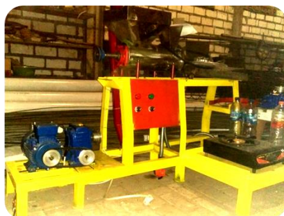
Gambar 2 Hasil perancangan mesin

Apabila digunakan untuk memasak bakpia dalam waktu 8 jam kerja, mesin pengolah kumbu bakpia yang dikembangkan dapat mengolah 24 kg kacang ijo menjadi kumbu bakpia. Berdasarkan kondisi aktual, 1 kg kacang hijau dapat menghasilkan yang 100 butir bakpia atau 5 kardus bakpia, sehingga dengan penggunaan mesin akan mampu dihasilkan sebanyak 2400 butir bakpia atau 120 kardus bakpia.