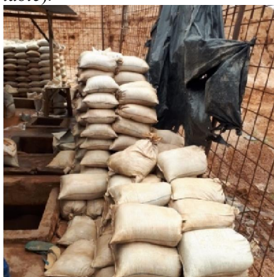
Gambar 2. Bijih timah (kalsiterit) dengan kadar tertentu (%)

Salah satu langkah dalam proses penambangan timah adalah hasil dari proses pencucian bijih timah dilakukan proses pemisahan dengan menggunakan meja getar ( shaker table ). Pada Gambar 2 merupakan kumpulan karung yang berisi bijih timah (kalsiterit) dengan kadar tertentu (%) sebagai hasil akhir dari proses meja getar ( shaker table ) yang telah ditetapkan oleh pemegang izin usaha pertambangan (IUP) operasi produksi timah. Kumpulan karung tersebut dikumpulkan dalam lokasi yang tidak jauh dari meja getar ( shaker table ).