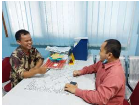
Gambar 4 Koordinasi membahas kebutuhan para guru SDIT, RA dan MTS

Konsultasi dengan salah satu staff Yayasan Daarul Quran bapak andri pada bulan juni 2022