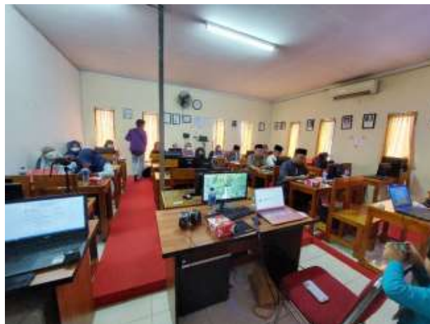
Gambar 20 Suasana Kelas Saat Workshop

Workshop ini diikuti oleh peserta dengan antusias, cukup banyak peserta yang bertanya mengenai video editing dan animasi