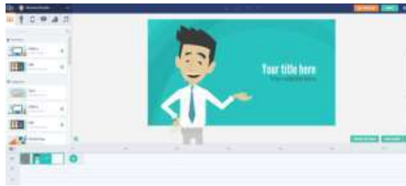
Gambar 9 Pembuatan Materi Animaker