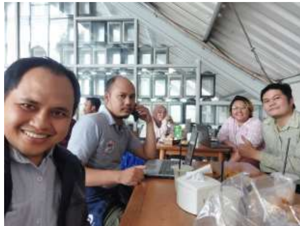
Gambar 1 Rapat Koordinasi Pengabdian Masyarakat

Rapat pembuatan konsep pengabdian kami lakukan sambil merumuskan untuk persiapan pengurusan akreditasi