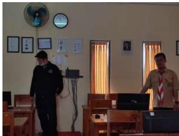
Gambar 7 Mengecek Ruangan Workshop

Setelah melakukan koordinasi Tim melakukan pengecekan ruangan dan mempersiapkan kebutuhan untuk workshop.