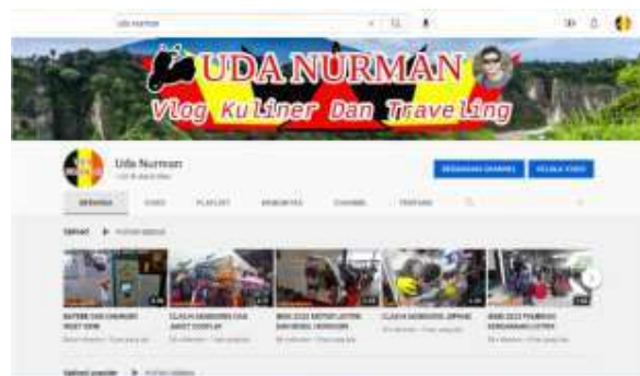
Gambar 11 Pembuatan Materi Upload Konten

Pembuatan materi Upload channel, ketua pengabdian selain dosen beliau juga seorang youtuber.