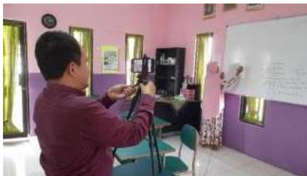
Gambar 21 workshop teknik pengambilan gambar

Selain dikelas peserta juga diajak untuk membuat video menggunakan kamera smartphone di ruang lainnya.