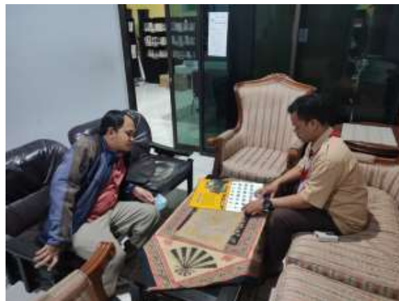
Gambar 5 Koordinasi Menentukan Tanggal Pelaksanaan Workshop 1

Pada bulan juli 2022 Tim melakukan koordinasi untuk menentukan tanggal pelaksanaan workshop, rencana awal bulan agustus 2022.