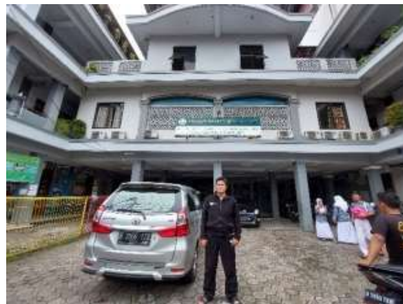
Gambar 2 Survey Lokasi Pengabdian

Setelah rapat koordinasi bersama kami melakukan koordinasi ke tempat pengabdian Yayasan Daarul Quran Tebet.