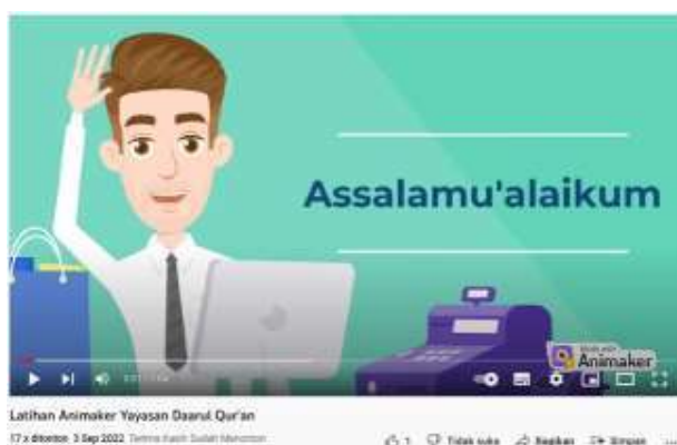
Gambar 22 Hasil karya salah satu peserta Bpk. Andri

Pelaksanaan kegiatan workshop dilakukan pada hari Sabtu 3 September 2022 dan diberikan konsultasi via online untuk membuat karya sendiri selama satu minggu hingga tanggal 10 September 2022. Namun karena kesibukan para guru sehingga banyak yang tidak sempat menyelesaikan videonya, namun masih ada peserta yang antusias menyelesaikan video animasi dan telah di upload ke youtube, berikut salah satu dokumentasi video yang telah dibuat oleh peserta :