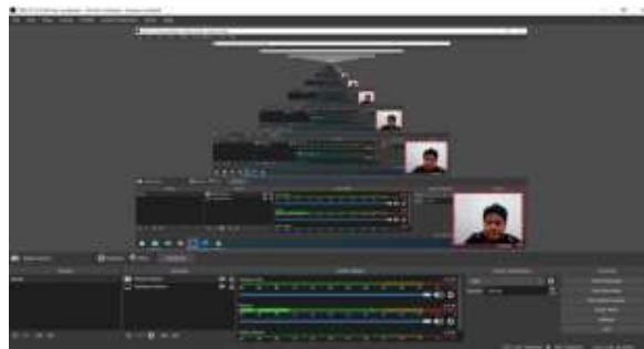
Gambar 8 Pembuatan Materi Pengambilan Gambar

Selama masa koordinasi tim pengabdian melakukan pembuatan materi pelatihan