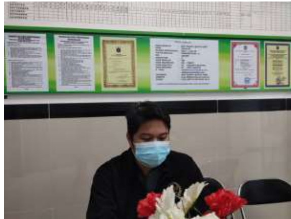
Gambar 6 Koordinasi Menentukan Tanggal Pelaksanaan Workshop 2

Pada bulan agustus 2022 tim pengabdian melaksanakan koordinasi ke dua untuk menentukan pelaksanaan workshop, kegiatan yang awalnya akan diadakan agustus menjadi mundur karena pada bulan itu ketua tim mengalami kecelakaan.