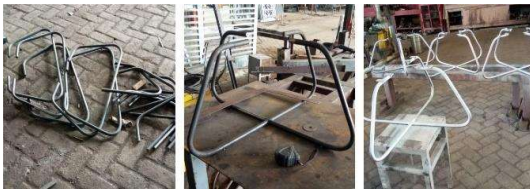
Gambar 6. Proses fabrikasi purnarupa kaki meja

Ketiga, melakukan pengembangan pemasaran produk baru untuk desain upcycling melalui kegiatan bersama membuat materi dokumentasi visual dalam bentuk digital untuk produk baru yang tercipta yang dapat dijadikan bahan untuk dipublikasikan di berbagai media sosial maupun pameran produk interior sebagai strategi pemasaran yang berbeda dari sebelumnya. Kegiatan ini dilakukan sebagai tindak lanjut dari terdokumentasikannya secara visual-digital-estetik produk baru interior dan elemen arsitektural yang siap di publikasikan di media sosial dan platform penjualan secara langsung maupun daring. Kegiatan ini pada dasarnya bertujuan untuk meningkatkan penjualan produk dan jasa yang dilakukan dengan media sosial lewat platform market place di samping secara konvensional yaitu lewat pameran-pameran lokal maupun internasional (Bennington, 2004).