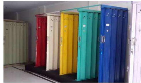
Gambar 2. Gambaran produk regular yang dihasilkan