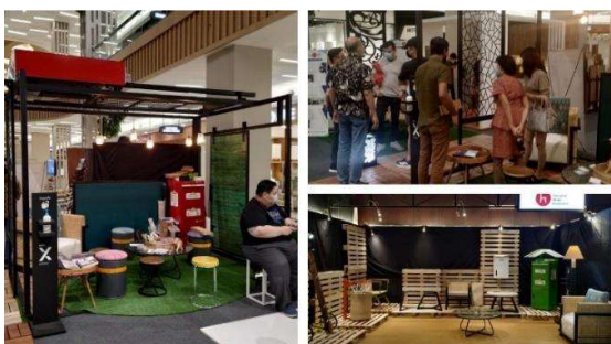
Gambar 7. Pameran uji pasar produk hasil kegiatan PKM

Ketiga, melakukan pengembangan pemasaran produk baru untuk desain upcycling melalui kegiatan bersama membuat materi dokumentasi visual dalam bentuk digital untuk produk baru yang tercipta yang dapat dijadikan bahan untuk dipublikasikan di berbagai media sosial maupun pameran produk interior sebagai strategi pemasaran yang berbeda dari sebelumnya. Kegiatan ini dilakukan sebagai tindak lanjut dari terdokumentasikannya secara visual-digital-estetik produk baru interior dan elemen arsitektural yang siap di publikasikan di media sosial dan platform penjualan secara langsung maupun daring. Kegiatan ini pada dasarnya bertujuan untuk meningkatkan penjualan produk dan jasa yang dilakukan dengan media sosial lewat platform market place di samping secara konvensional yaitu lewat pameran-pameran lokal maupun internasional (Bennington, 2004).