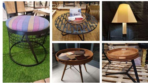
Gambar 8. Produk hasil kegiatan kreativitas PKM

Sebagai gambaran kegiatan ini menghasilkan produk-produk kreativitas yang layak untuk dijual di pasaran, dapat dilihat pada Gambar 8.