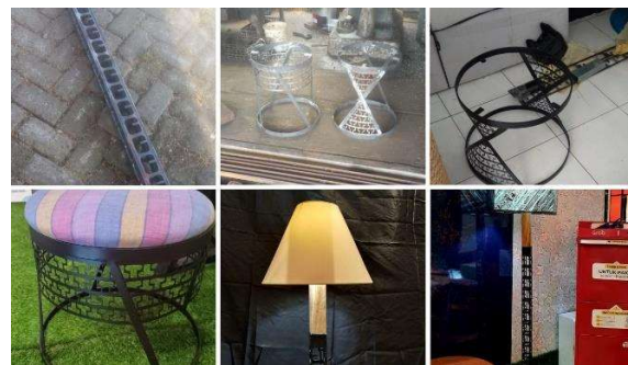
Gambar 9. Produk kreativitas dari tim mitra PKM

Kegiatan ini diteruskan oleh mitra dengan menghasilkan produk-produk kreativitas lainnya yang juga sudah dikomersialisasikan. Gambar 9 merupakan beberapa desain hasil kreatifitas dari mitra sendiri setelah kegiatan inti pengabdian masyarakat bersama mitra PT Varia Cipta Pratama selesai.