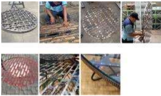
Gambar 5. Proses fabrikasi prototyping produk