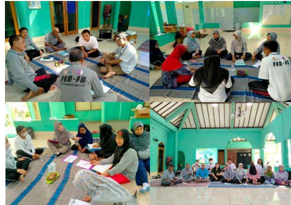
Gambar 2. Foto Kegiatan Intervensi Psikologi Positif

yang digunakan sebagai bahan focus group discussion .