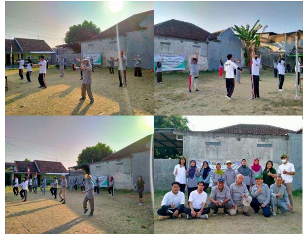
Gambar 1 Foto Kegiatan Senam Lansia

Pada kegiatan senam lansia ini, setiap pertemuan para lansia melakukan senam olah tubuh dan senam otak sebagai kegiatan penutupnya. Selama pelaksanaan senam, antusiasme para lansia sangat besar, hal ini terlihat dari keinginan mereka untuk menambah alokasi waktu senam yang semula hanya 30 menit menjadi 60 menit. Berikut rincian gerakan senam yang telah diberikan kepada para lansia selama lima pertemuan: