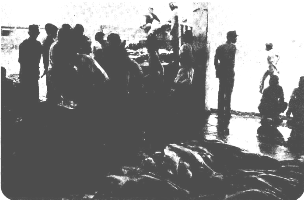
Gambar 4. Kegiatan penjualan ikan di tempat pelelangan ikan (TPI).