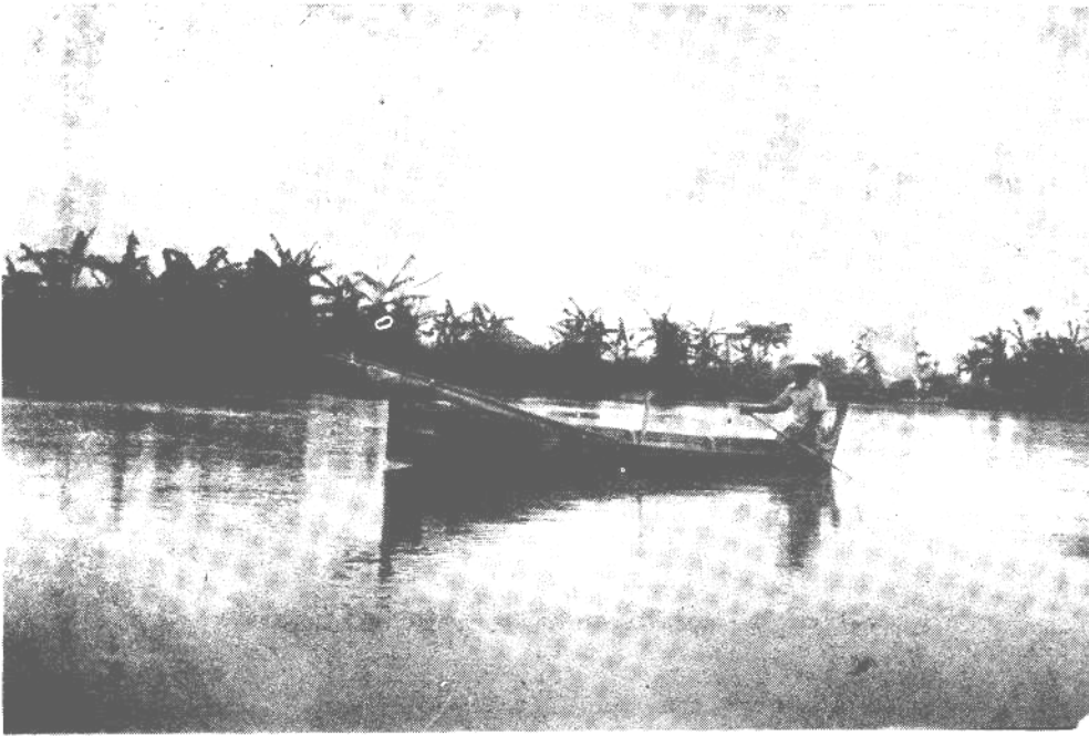
Gambar 1. Sarana penangkapan.dengan perahu tanpa motor.