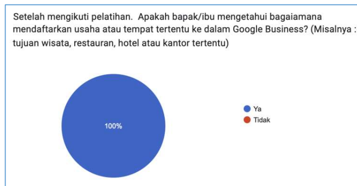
Gambar 9. Grafik Responden Tentang Pengetahuan Mendaftarkan Usaha Ke dalam GMB Setelah Pelatihan