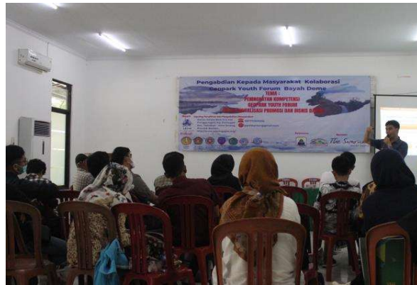
Gambar 3. Peserta (Geopark Youth Forum) Pelatihan Kegiatan PKM