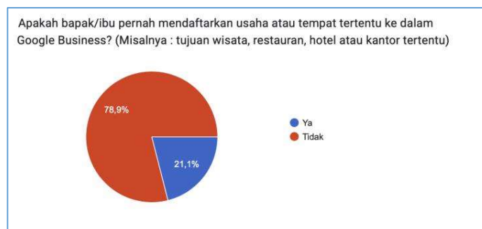
Gambar 7. Grafik Jawaban Responden Tentang Kemungkinan Menggunakan GMB Untuk Pengelolaan Usaha