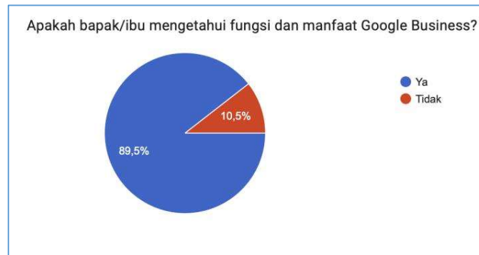
Gambar 6. Grafik Jawaban Responden Tentang Fungsi dan Manfaat GMB