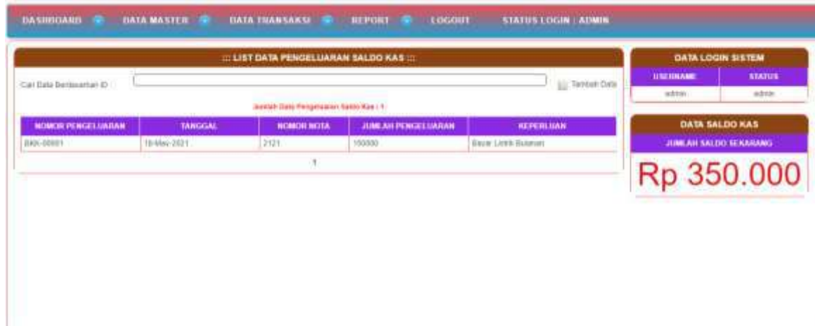
Gambar 4. Implementasi Data Pengeluaran

Tampilan menu data pengeluaran berfungsi untuk melihat akun yang telah tersimpan dalam database untuk data pengeluaran. Di dalam data pengeluaran yang nomor pengeluaran, tanggal, nomor nota, jumlah pengeluaran.