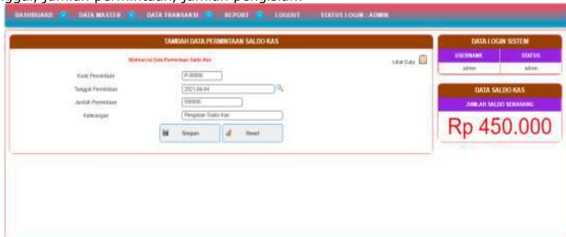
Gambar 5. Implementasi Data Pengisian Saldo Kas

Tampilan menu data pengisian berfungsi untuk melihat akun yang telah tersimpan dalam database untuk data pengisian. Di dalam data pengisian yang nomor pengisian, tanggal, jumlah permintaan, jumlah pengisian.