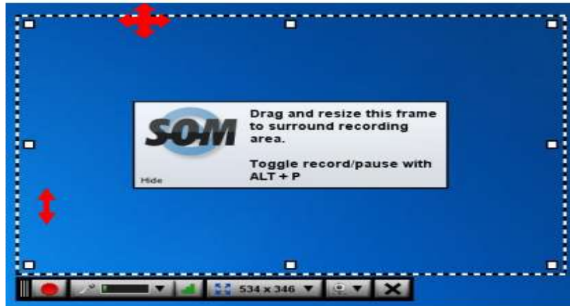
Gambar 4. Screen recorder