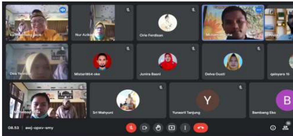
Gambar 1. Pembukaan Pelatihan