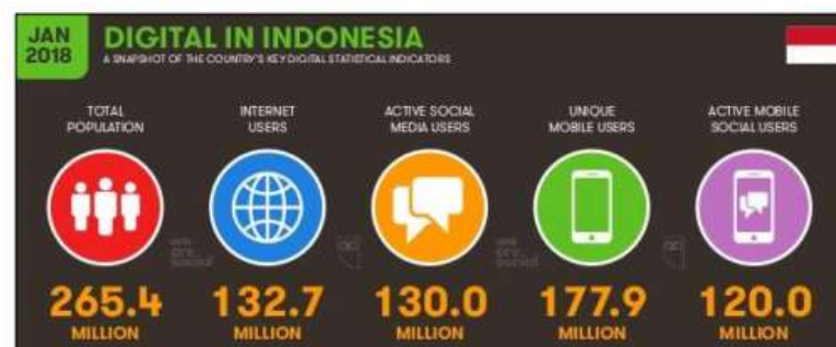
Gambar 2. Data Infografis di Indonesia

Dilihat dari hasil survey yang telah dilakukan oleh Kementerian Informasi dan UNICEF tahun 2014 yang telah mengelompokkan pengguna berdasarkan komposisi usia, presentase pengguna smartphone yang termasuk kategori usia anak-anak dan remaja di Indonesia cukup tinggi, yaitu sekitar 79,5 % (Wulandari, 2016). Sedangkan menurut data terbaru yang telah diterbitkan Hootsuite pada bulan Januari 2018 ada 177,9 juta jiwa penduduk Indonesia yang sebagai pengguna aktif mobile phone dari total penduduk 265,4 juta jiwa.