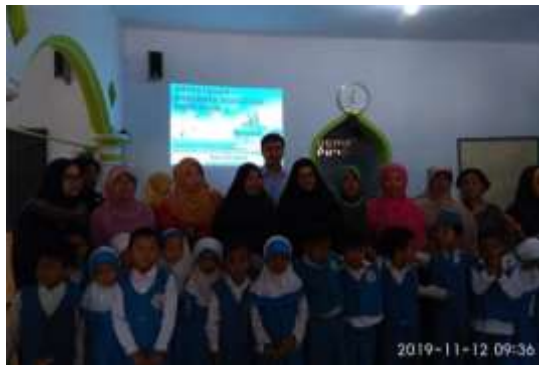
Gambar 3. Peserta Penyuluhan

Kondisi orang tua selama kegiatan penyuluhan, orang tua memperhatikan penyuluhan secara seksama hal ini dibuktikan dengan ada beberapa pertanyaan yang diutarakan oleh orang tua terkait materi yang disampaikan. Secara keseluruhan kegiatan berlangsung dengan tertib dan lancar. Antusiasme orang tua juga bagus hal ini dibuktikan dengan orang tua datang ke acara tepat waktu, dan mengikuti kegiatan sampai akhir.